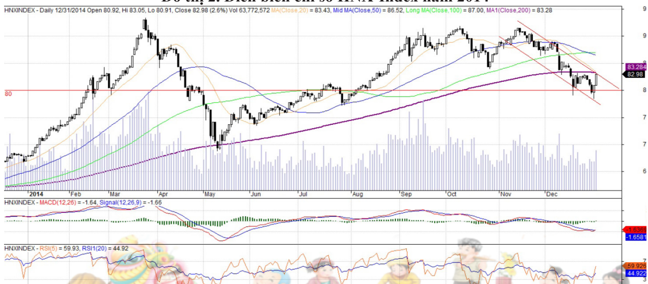
Đồ thị 2. Diễn biến chỉ số HNX-Index năm 2014