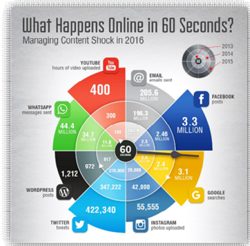
Hình 1. Đồ họa mô tả

tượng. Chẳng hạn, tại thời điểm 2016, mỗi 60 giây, Facebook có đến 3,3 triệu mục thông tin đưa đăng tải, 205,6 triệu email được gửi đi, 3,1 triệu lượt tìm kiếm Google, 400 giờ video được đăng tải lên Youtube,... (xem Hình 1)