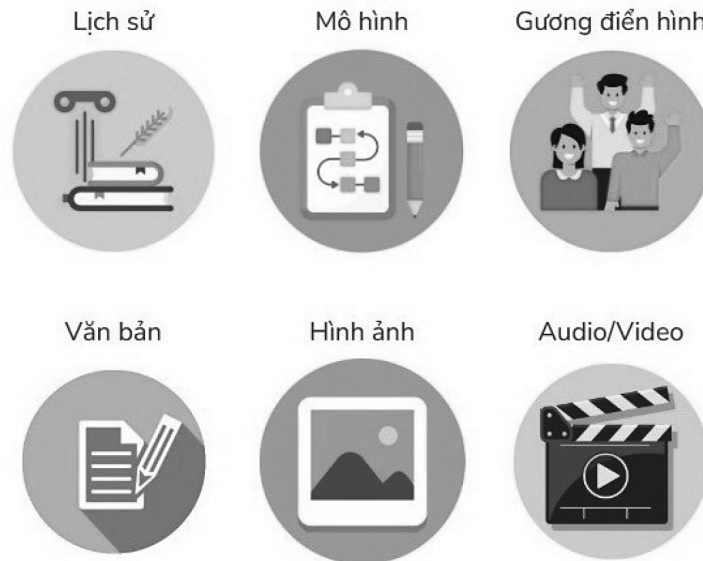
Hình 2. Các bộ sưu tập tư liệu số

Tỉnh Đoàn đã xây dựng 06 bộ sưu tập tư liệu số, trong đó Bộ sưu tập tư liệu số văn bản Đoàn TNCS Hồ Chí Minh và phong trào Thanh thiếu nhi tỉnh Bến Tre với 3.476 văn bản bao gồm công văn, kế hoạch, báo cáo, quyết định, hướng dẫn, nghị quyết, đề án,... được số hóa. Bộ sưu tập hình ảnh với 2.287 hình ảnh, đặc biệt trong đó có gần 200 bức ảnh mô tả công tác Đoàn và phong trào thanh thiếu nhi thập niên 80 và 90 đây là nguồn tư liệu vô cùng quý giá. Bộ sưu tập Audio/Video với 215 video clip bao gồm các video công tác Đoàn và phong trào thanh thiếu nhi, video các cuộc thi do Tỉnh đoàn tổ chức đặc biệt là có các video phỏng vấn cựu cán bộ Đoàn từ tỉnh đến cơ sở với các nội dung phỏng vấn về giới thiệu quá trình và dấu ấn khi tham gia công tác Đoàn, các chia sẻ gửi gắm cho thế hệ trẻ. Ngoài ra, còn có những câu chuyện về gương các thanh thiếu nhi dũng cảm trong hai cuộc kháng chiến. Bộ sưu tập Gương điển hình với 03 nội dung gương điển hình công tác hội, gương điển