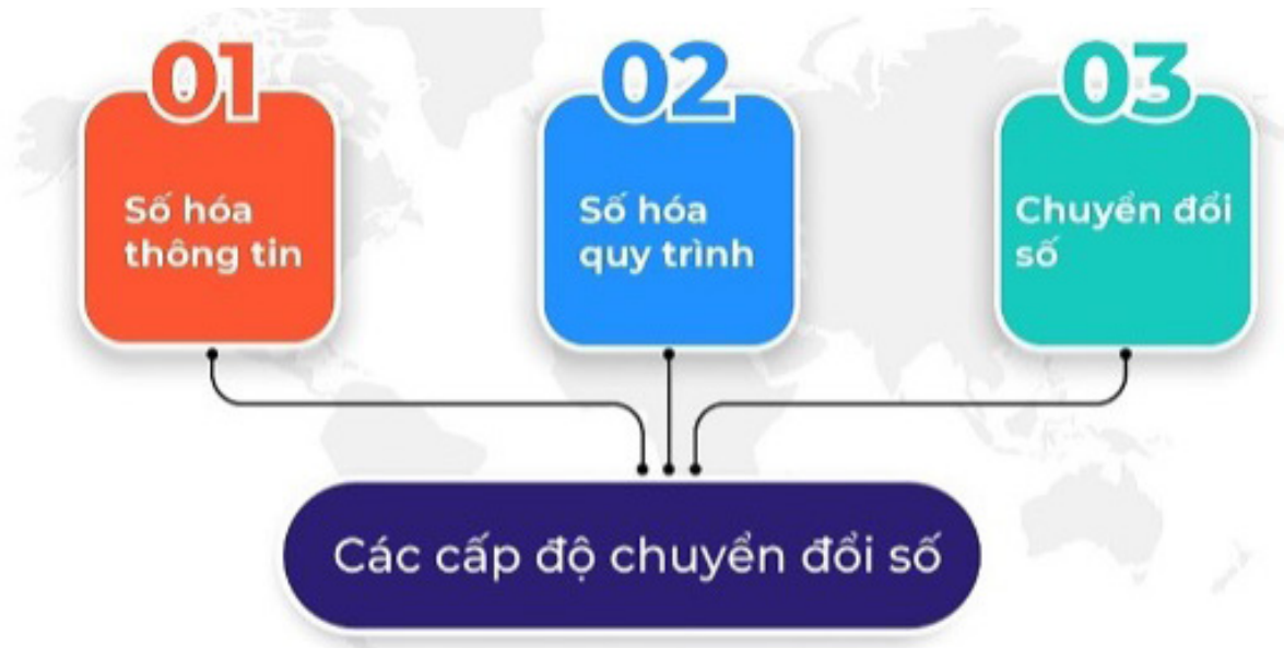
Các cấp độ chuyển đổi số trong kiến trúc

Trong thiết kế kiến trúc, một số ứng dụng được thúc đẩy áp dụng như tự động hoá, tối ưu hoá thiết kế (generative design), xây dựng thư viện đối tượng, công nghệ thực tế ảo/ thực tế tăng cường (VR/AR) giúp hỗ trợ quá trình lựa chọn thiết kế hay các phần mềm giúp tự động hoá một số nội dung trong thẩm tra thiết kế... Qua đó đảm bảo bản thiết kế được sử dụng là tốt nhất, phù hợp nhất.