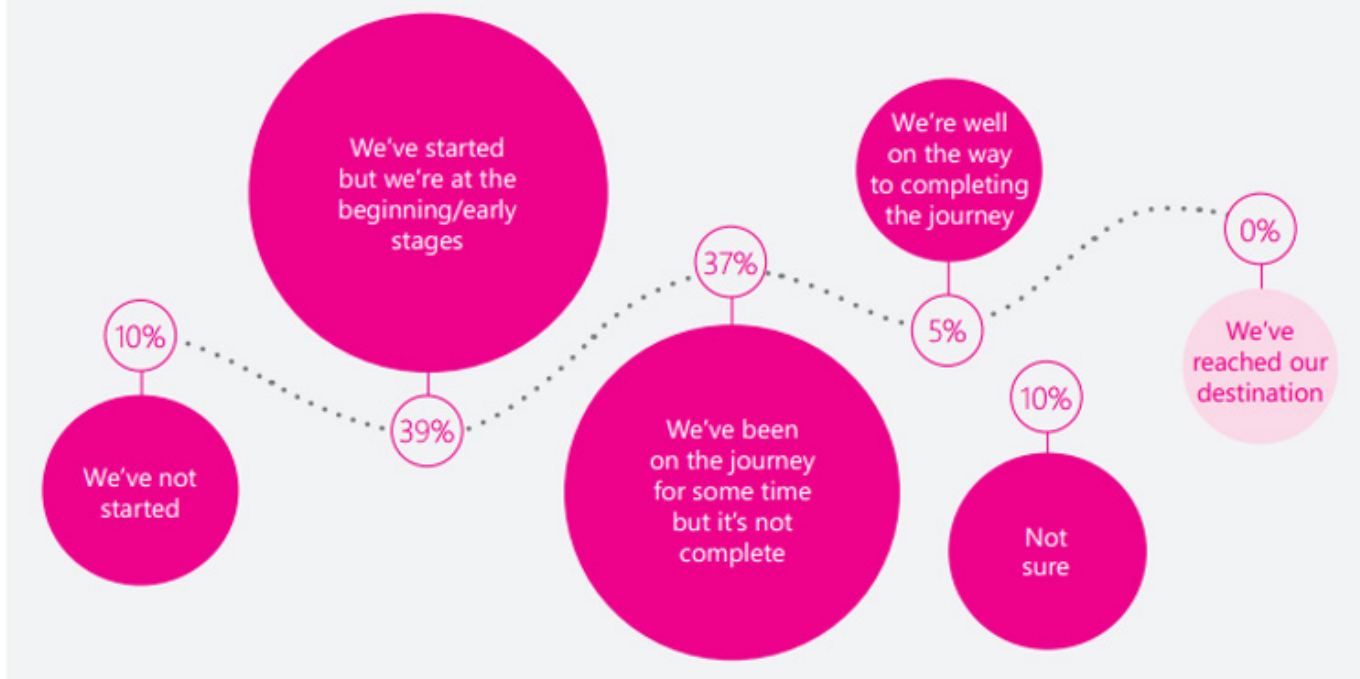
Mức độ "sẵn sàng" của KTS đối với chuyển đổi số

If digital transformation was a journey, where is your practice on that journey?