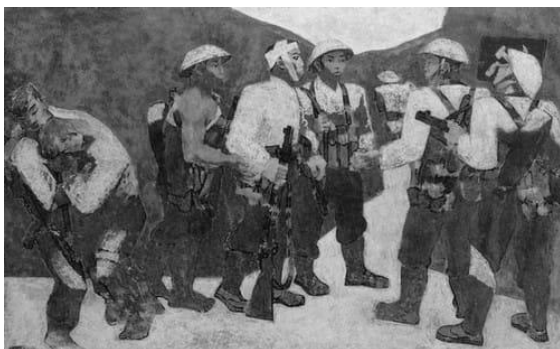
Hình 2. “ Kết nạp Đảng ở Điện Biên Phủ ” - Nguyễn Sáng

Tác phẩm “ Kết nạp Đảng ở Điện Biên Phủ ” của Nguyễn Sáng là một trong những tác phẩm thành công nhất về hình tượng người chiến sĩ. Điện Biên không chỉ là đỉnh cao của chiến thắng mà còn là biểu tượng cho ý chí của dân tộc ta. Biểu hiện được điều ấy, trước hết đó là chỗ mạch đầu tiên của tác phẩm. Nguyễn Sáng thể hiện một buổi lễ kết nạp Đảng ngay trong chiến hào. Những anh bộ đội với vóc dáng chắc khỏe của người nông dân, những chiến sĩ tiêu biểu nhất vừa trải qua một cuộc chiến đấu quyết liệt với quân thù; Một người đỡ đồng đội bị thương, một người đứng thẳng nghiêm trang như tuyên thệ trước lá cờ Đảng được treo trên vách chiến hào, một người vừa lao đi như quyết chiến đấu với quân thù, để trả thù cho những đồng đội đã hy sinh. Bố cục chắc khỏe, hình được cách điệu và đơn giản trong một hoà sắc nâu, vàng đậm. Toàn bộ tác phẩm là một bức chân dung tập thể của các chiến sĩ Điện Biên, sẵn sàng hy sinh cho chiến thắng. Tình yêu Tổ Quốc và lòng căm thù giặc đã biến thành sức mạnh trong mỗi người chiến sĩ, đó là hình tượng người chiến sĩ trong những năm kháng chiến chống Pháp.