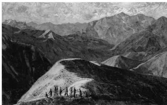
Hình 1. “Nhớ một chiều Tây Bắc” - Phan Kế An

Việt Bắc, vào chiến khu cũng là những người tìm đến cái mới, cái tiến bộ. Những ngày sống cùng kháng chiến đã thôi thúc các nghệ sĩ sáng tác về người chiến sĩ.