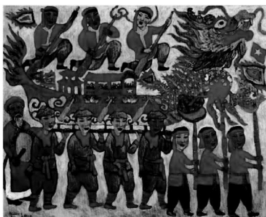
“Lễ hội cầu ngư” - Sơn dầu – Bùi Văn Quang