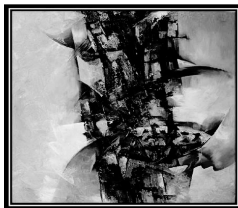
“Ngày biển lặng” – Sơn dầu – Trần Mạnh Đức