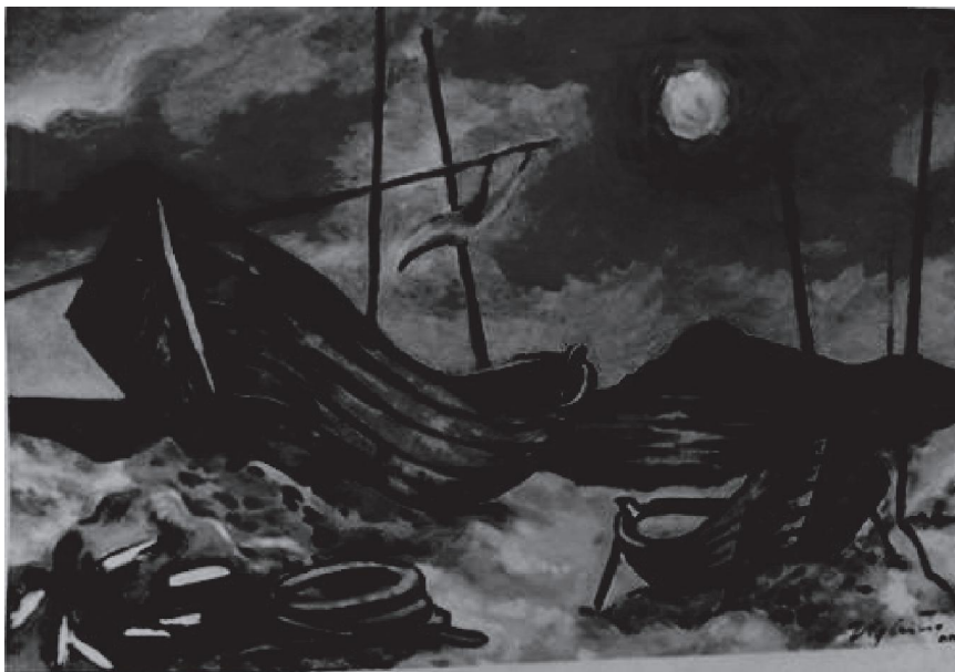
“Biển” – Sơn dầu – Nguyễn Ngọc Cường