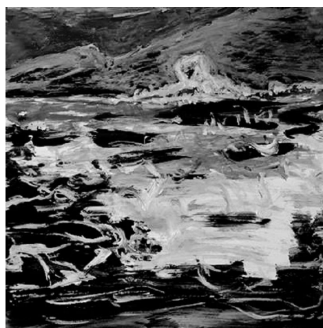
“Phong cảnh Hòn Chồng” – Acrylic – Lê Dân