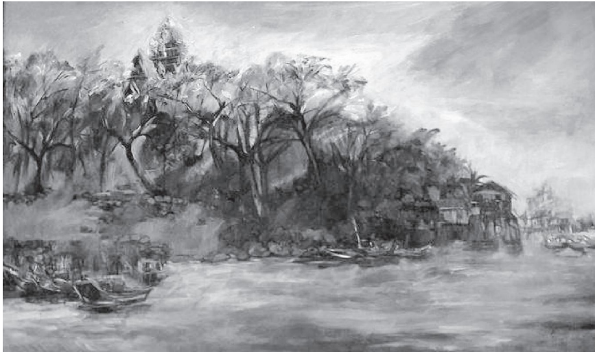
“Tháp bà Ponagar” – Acrylic – Phạm Chính Nam