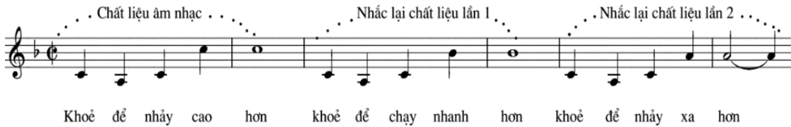
Hình 3. Trích ca khúc Bài ca Hội khỏe Phù Đổng Quảng Ninh (Nguyễn Thị Lý, 2008, tr 15)

giai điệu bằng cách nhắc lại có thay đổi hai lần liên tục chất liệu âm nhạc đó (Hình 3). Chất liệu âm nhạc được nhắc đi nhắc lại kết hợp với nội dung của lời ca làm cho giai đoạn đầu của ca khúc như một sự khẳng định về những lợi ích quý báu của việc rèn luyện sức khỏe, đây cũng chính là nội dung chủ đề mà ca khúc chuyển tải tới người nghe.