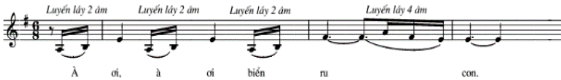
Hình 7. Trích ca khúc Lời ru trên vịnh Hạ Long (Nguyễn Thị Luyến, 2008, tr 38)

tác theo thể loại Hát ru với sự nhịp nhàng của loại nhịp 6/8, kết hợp cùng thang âm mềm mại của điệu thức Mi thứ, đường nét giai điệu của ca khúc vang lên đậm nét êm đềm, du dương. Tuy nhiên, để làm tăng thêm tính chất ngọt ngào, sâu lắng, phù hợp hơn với nội dung của lời ca, tác giả đã sử dụng rất nhiều lần sự kết hợp của hai âm, đôi khi là bốn âm luyến láy trong cùng một lời ca (Hình 7). Từ đó giúp cho đường nét giai điệu của ca khúc thể hiện chân thực hơn về những cảm xúc thiêng liêng của tình mẫu tử được gửi gắm trong ca khúc.