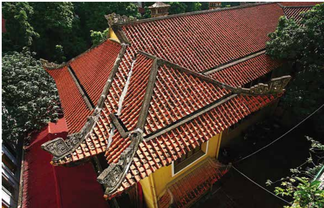
Hình 10. Mái ngói cong ở biệt thự số 4 Lý Nam Đế

+ Cửa sổ được bố trí khá dày đặc, cao để tăng sự thông thoáng. Phổ biến