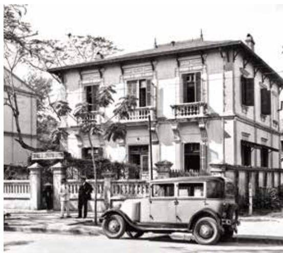
Hình 7. Biệt thự phong cách miền Nam nước Pháp (Ảnh chụp khoảng 1920 -1929)

Ở giai đoạn này, phong cách kiến trúc cổ điển Pháp mất dần vị trí độc tôn. Một