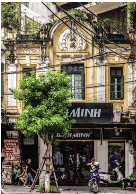
Hình 3. Biệt thự tân cổ điển thuần khiết