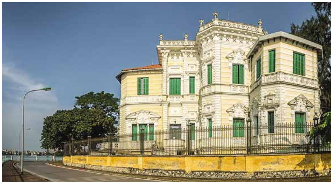
Hình 4. Biệt thự Schneider trong khuôn viên trường THPT Chu Văn An hiện nay

Tiếp theo, nhiều công trình biệt thự được xây dựng theo phong cách kiến trúc địa phương Pháp, thể hiện tâm lý vọng quê của những người Pháp đầu tiên đến định cư tại Hà Nội, với mong muốn có được ngôi nhà như ở quê hương mình. Họ xây dựng những công trình theo đúng như mẫu nhà ở bản quán.