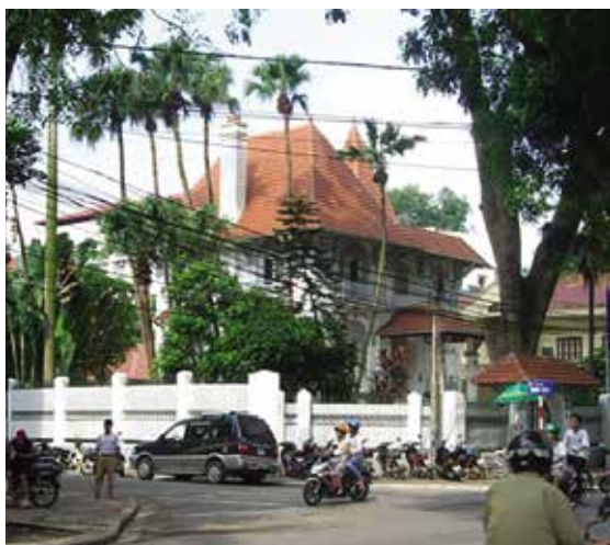
Hình 5. Biệt thự phong cách miền Bắc nước Pháp tại ngã ba Lê Hồng Phong - Khúc Hạo

1) Biệt thự phong cách miền Bắc nước Pháp được đặc trưng bởi hệ mái đa diện có độ dốc lớn để tuyết không thể đọng trên mái, rất phù hợp với khí hậu lạnh mùa đông ở vùng này. Phần mái nhô ra khỏi tường khá rộng được đỡ bởi hệ console gỗ nhẹ nhàng. Trên mái được tô điểm thêm những tháp nhỏ, hoặc ống khói cao làm tăng phần duyên dáng của bộ mái. Thân nhà trang trí đơn giản và nhấn mạnh theo chiều đứng, với sự phân chia các thành phần chính, phụ rất rõ ràng, độ cao tầng khá lớn. Hệ thống các