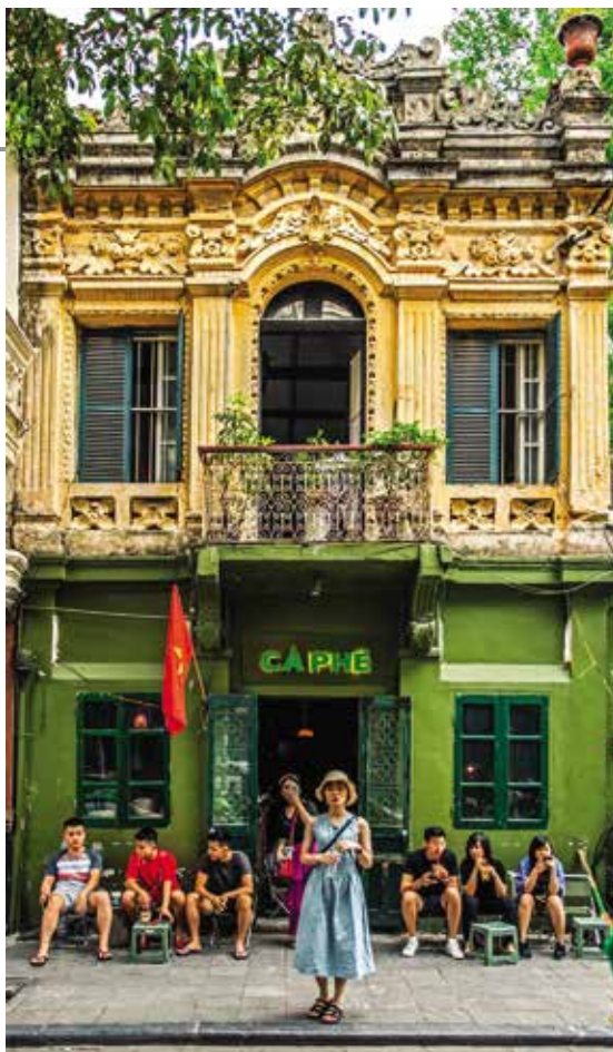
Hình 2. Biệt thự tân cổ điển duy lý

1) Biệt thự tân cổ điển duy lý đặc trưng, bởi bố cục hình khối tương đối đơn giản và mặt đứng hoàn toàn đối xứng. Khối giữa nhà luôn được tổ chức nhô ra phía trước, trong nhiều trường hợp còn được nhấn mạnh bởi một ban công duy nhất phía trên lối vào chính, nơi tập trung nhiều họa tiết trang trí nhằm tạo sự trang trọng và tính bề thế cho công trình. Hệ thống cửa sổ và cửa đi thường được tổ chức vuông vắn, hai phía cửa được trang trí bởi các thức cột cổ điển nâng một ô văng nhỏ, nhưng giàu tính trang trí phía trên. Mặc dù sử dụng các họa tiết mang tính cổ điển trong các hình thức trang trí lan can, ban công và xung quanh các cửa, song chỉ ở mức độ vừa phải, hợp lý. Phân vị ngang theo tầng nhà được nhấn mạnh bằng hệ thống phào theo phương ngang được trang trí nhẹ nhàng. Các góc nhà thường có hình thức đắp vữa giả cột, tạo sự kết thúc theo phương ngang của công trình. Mái có riềm hình băng ngang hoặc riềm kiểu con tiện. Một số nhỏ biệt thự sử dụng mái Mansard lợp ngói đá phiến màu sẫm, kết hợp với những ô cửa nhỏ hình tròn có các họa tiết trang trí xung quanh.