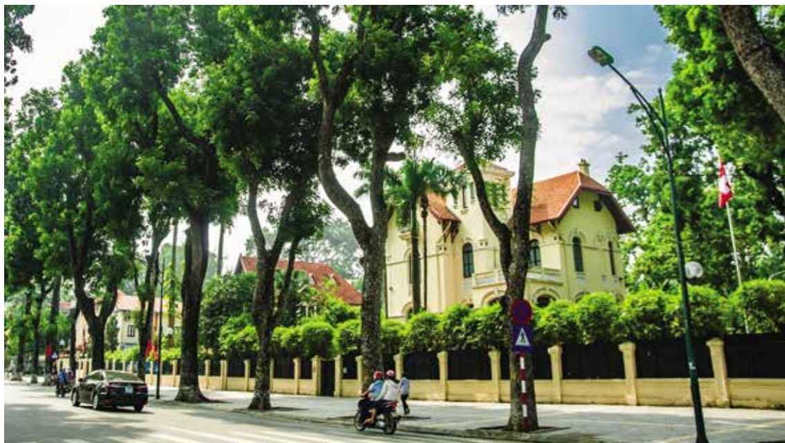
Hình 6. Biệt thự phong cách miền Trung nước Pháp tại đường Điện Biên Phủ

3) Biệt thự phong cách miền Nam nước Pháp , nơi có khí hậu ôn hòa nhất nước Pháp, có bộ mái ngói với độ dốc khá nhỏ và những ống khói thấp. Hình khối kiến trúc các biệt thự loại này khá phong phú. Những hàng hiên rộng mở, kết hợp với các trụ gạch đỡ giàn hoa bê tông cũng là nét duyên dáng riêng của biệt thự loại này. Hệ thống các họa tiết trang trí được thống nhất từ cửa vào chính qua các hàng cột. Nhiều công trình có giàn hoa trên hàng hiên, phía trên các cửa tầng hai, tới điểm trang trí dưới mái tạo ra sự sang trọng và tao nhã cho ngôi nhà.