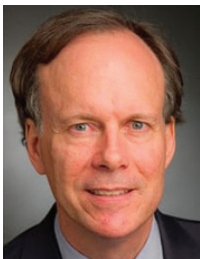
William G. Kaelin Jr