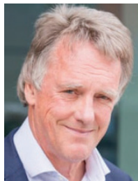
Sir Peter J. Ratcliffe