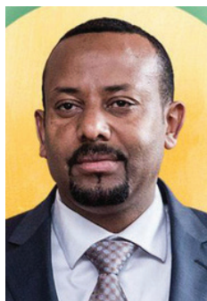
Abiy Ahmed Ali

Giải Nobel Hoà bình năm 2019 đã được quyết định trao cho ông Abiy Ahmed Ali (sinh năm 1976, Thủ tướng của nước Cộng hòa Dân chủ Liên bang Ethiopia) vì những nỗ lực của ông nhằm đạt được hoà bình, quan hệ quốc tế và đặc biệt là sáng kiến mang tính quyết định để giải quyết cuộc xung đột với nước láng giềng Eritrea.