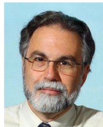
Gregg L. Semenza

Giải Nobel Y học 2019 đã được trao cho 3 nhà khoa học: William G. Kaelin Jr (sinh năm 1957, người Mỹ, đang làm việc tại Đại học Y khoa Harvard, Mỹ), Sir Peter J. Ratcliffe (sinh năm 1954, người Anh, đang làm việc tại Đại học Oxford, Vương quốc Anh) và Gregg L. Semenza (sinh năm 1956, người Mỹ, đang làm việc tại Đại học Johns Hopkins, Mỹ) vì những phát hiện của họ về cách tế bào cảm nhận và thích ứng với lượng oxy.