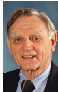
John B. Goodenough