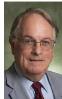
M. Stanley Whittingham