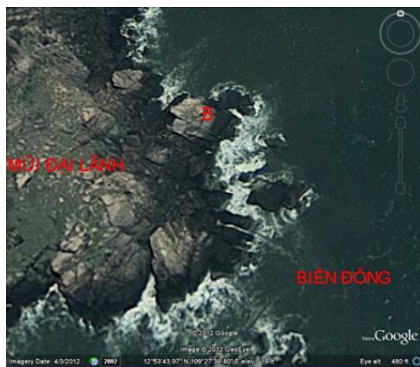
Hình 5. Vị trí điểm nhô ra biển xa nhất ở mũi Đại Lãnh

(Tọa độ địa lý của điểm nhô ra biển xa nhất (B) được Google Earth hiển thị là 109^{\circ}27'30.80''\text{Đ} ; 12^{\circ}53'43.97''\text{B} )