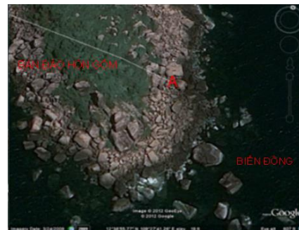
Hình 3. Vị trí điểm nhô ra biển xa nhất ở bán đảo Hòn Gốm