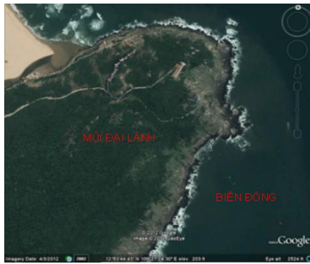
Hình 4. Mũi Đại Lãnh

+ Ở mũi Đại Lãnh :