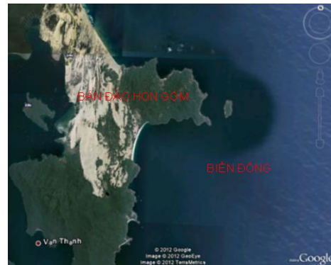
Hình 1. Một phần của Bán đảo Hòn Gốm

* Dưới đây là các hình ảnh minh họa