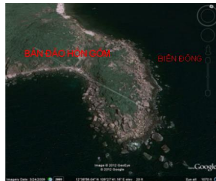
Hình 2. Phần nhô ra biển xa nhất ở Bán đảo Hòn Gốm