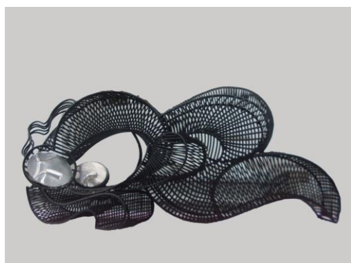
Một số tác phẩm Tốt nghiệp, chủ đề tình Mẫu tử, chất liệu sắt hàn