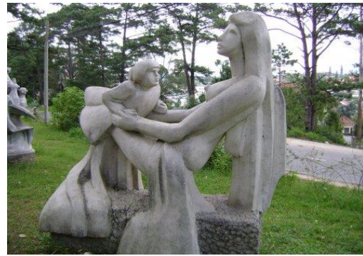
Tượng mẹ và con của nhà Điêu khắc Phạm Văn Hạng Chất liệu: Xi măng Kích thước: 1m50 x 0,90m