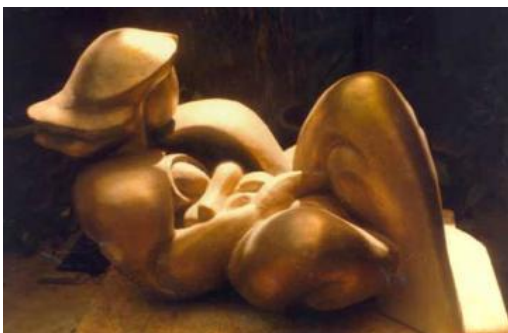
Tượng mẹ và con của nhà Điêu khắc Phạm Hùng Chất liệu: Đồng Kích thước: 1m20 x 0,60m