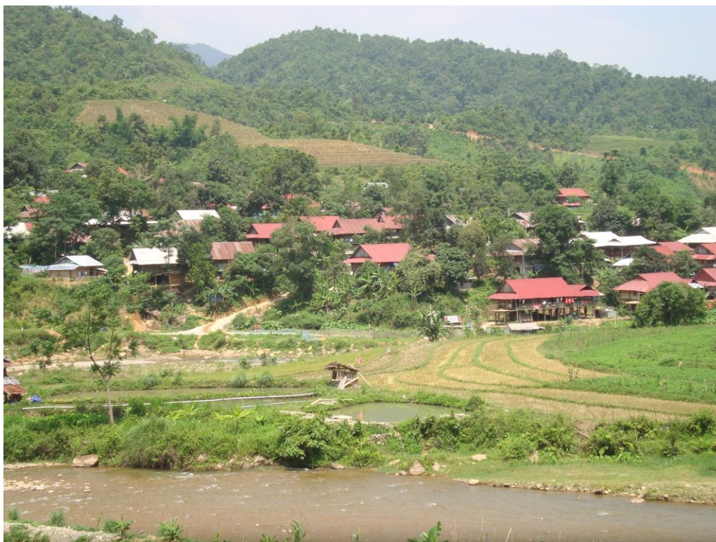
Bản của người Thái ở xã Vàng San, huyện Mường Tè, tỉnh Lai Châu

13. Viện Khoa học Lao động và Xã hội (2012), Đánh giá thực trạng khả năng và cơ hội tiếp cận dịch vụ xã hội của nhóm người nghèo, đối tượng dễ bị tổn thương, đặc biệt là tại các vùng sâu, vùng xa, vùng dân tộc thiểu số , Hà Nội.