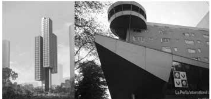
Các công trình của Koolhaas ở Singapore (trái) and Amsterdam (phải)

những dự án khác nhau được thực hiện hoặc tưởng tượng cho hòn đảo Manhattan. New York trở thành phòng thí nghiệm và là hình ảnh ẩn dụ của tất cả các đô thị đương đại. Nó thể hiện nhận thức về sự cần thiết phải xé bỏ "Chủ nghĩa Manhattan" 8 , bản sắc nghịch lý của sự hỗn loạn đô thị theo chiều này, được xây dựng phân vùng đều đặn, sử dụng các khối lớp. Để đối mặt với những đột biến trong tương lai, Rem Koolhaas đưa ra hình ảnh Manhattan như là một ví dụ hoàn hảo, định nghĩa của một "nền văn hóa tắc nghẽn" và "Chủ nghĩa Nhân văn", giá trị nguyên thủy của "điều kiện đô thị" đương đại, là những nguyên tắc cơ bản của các dự án tương lai của ông. Từ đó, sự hỗn loạn đô thị không còn đáng sợ nữa.