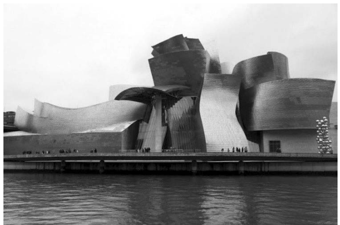
Bảo tàng Guggenheim Bilbao

Frank Gehry (1929) là Kiến trúc sư người Mỹ gốc Canada. Trong các công trình ban đầu, ông đã xây dựng các cấu trúc độc đáo, kỳ quặc, nhấn mạnh quy mô con người và tính toàn vẹn theo ngữ cảnh. Gehry ngày càng nổi tiếng vào cuối những năm 1990. Vào thời điểm đó, phong cách và thương hiệu của ông đã gắn liền với những tòa nhà giống như tác phẩm điêu khắc hình dạng tự do nhấp nhô. Hình thức này đạt đến đỉnh cao trong Bảo tàng Guggenheim Bilbao (1997) ở Tây Ban Nha, một cấu trúc được cho là đã gây ra sự bùng nổ xây dựng bảo tàng vào đầu thế kỷ 21.