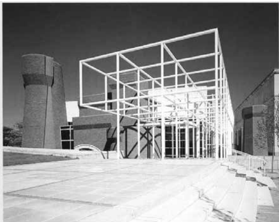
Góc nhìn từ phía nam trung tâm

Khi sử dụng phương pháp Đọc lệch - một phương pháp do Derrida đề nghị, Eisenman đã nhìn thấy những hạn chế áp đặt của chủ nghĩa mỹ học hiện đại đối với kiến trúc. Theo ý kiến của ông, hoạt động sáng tác kiến trúc phải được định nghĩa lại như một sự làm lệch hướng. Bắt đầu với những dự án đầu tiên về nhà ở, Eisenman đã giải phóng kiến trúc khỏi những định kiến truyền thống của nó. Trong những năm 1980 và 1990, ông tiếp tục đặt vấn đề về kiến trúc thông qua tư tưởng lý thuyết phi cấu trúc rất rõ ràng, làm rõ những xung đột, mâu thuẫn và nhầm lẫn trong việc biểu thị các thang đo về trật tự và cao độ. Một trong những công trình tiêu biểu được Eisenman thiết kế theo phong cách giải cấu trúc đó là trung tâm Nghệ thuật Wexner (Wexner Center for the Arts). Nhà phê bình Paul Goldberger của New York Times đã mệnh danh Trung tâm Nghệ thuật Wexner là “Bảo tàng mà lý thuyết kiến trúc được xây dựng lại”[33]. Peter Eisenman chất lọc hình thức kiến trúc thành một khoa học lý thuyết, đây là công trình công cộng lớn đầu tiên trong sự nghiệp của Eisenman, được khai trương vào năm 1989. Đối với một số người, nó báo trước một sự xác nhận của thuyết và lý thuyết giải cấu trúc.