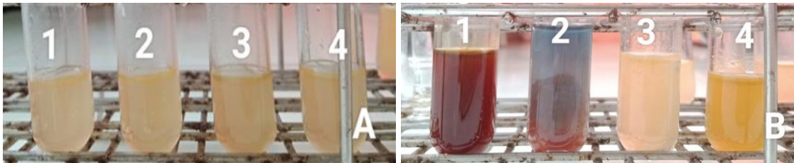
Hình 2. Định tính hợp chất có hoạt tính sinh học của dịch gấc.

Các ống chứa dịch chiết gấc đều xảy ra phản ứng hoá học, ở ống 1 có xuất hiện kết tủa đỏ nâu chứng tỏ có nhóm chất Alkaloid. Ống 2 xuất hiện kết tủa đỏ gạch nên ở gấc có nhóm Carbohydrate. Ống 3 có dung dịch chuyển sang màu vàng chứng tỏ có nhóm Flavonoid. Ống 4 có dung dịch chuyển màu hơi xanh vậy nên dịch gấc có nhóm Phenolic tuy nhiên ở nồng độ thấp.