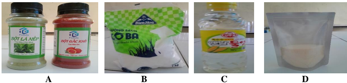
Hình 1. Nguyên liệu làm kẹo Marshmallow. (A) Bột lá dứa và gấc; (B) Đường; (C) Siro ngô; (D) Gelatin

Nguyên liệu làm kẹo Marshmallow bổ sung màu tự nhiên bao gồm: bột lá dứa và gấc (Công ty cp đầu tư Thanh Giang group), đường (Công ty cổ phần đầu tư thương mại bất động sản An Dương Thảo Điền), siro ngô (Công ty thực phẩm CJ food ) và gelatin (Công ty Navico ) (Hình 1).