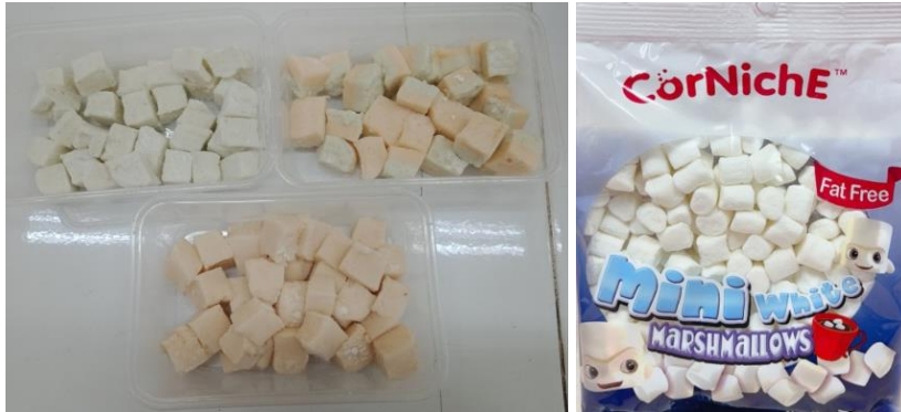
Hình 7. Kẹo Marshmallow bổ sung màu tự nhiên Hình 8. Kẹo Marshmallow trên thị trường