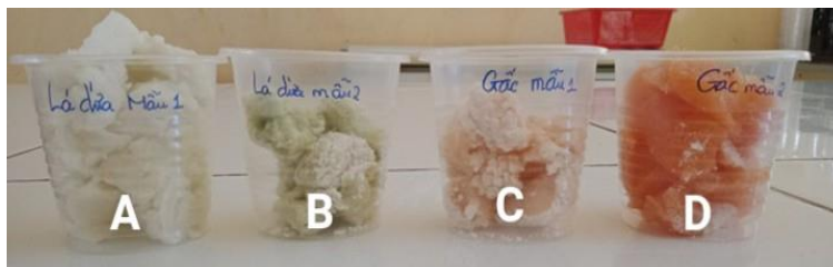
Hình 5. Kẹo Marshmallow ở các nồng độ dịch chiết lá dứa và gấc.

Sau khi ủ kẹo đến khi đông lại, sử dụng phương pháp đánh giá cảm quan 5 người. Kết quả mẫu kẹo chứa gấc 4mL và lá dứa 4mL được đánh giá cao hơn ở mẫu có chứa gấc 1mL và lá dứa 1mL. Màu kẹo ở mẫu lá dứa ở 4mL nhìn tươi và đẹp mắt hơn mẫu kẹo có lá dứa 1mL, đồng thời khi bổ sung lá dứa 4mL cho thấy rõ hương vị lá dứa hơn. Ở mẫu kẹo có gấc 4mL cho màu gấc nhìn đẹp mắt rõ mùi gấc hơn ở mẫu kẹo có bổ sung gấc 1mL. Ở mẫu kẹo chứa 1mL gấc, kẹo có màu nhạt nên màu sắc không được đánh giá cao so với 3 mẫu còn lại.