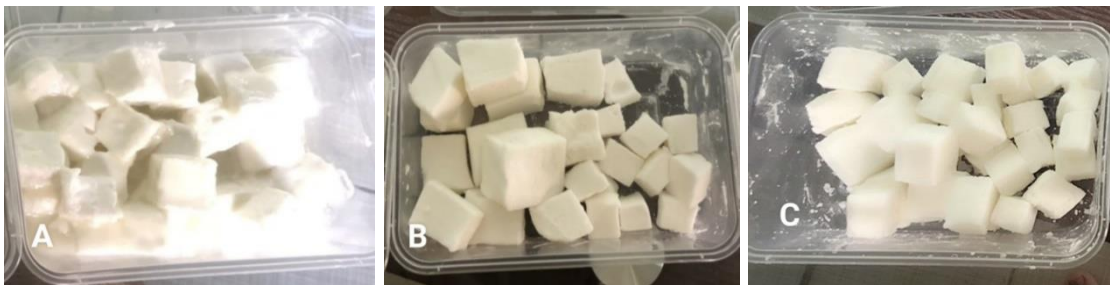
Hình 4. Kẹo Marshmallow ở các nồng độ gelatin khác nhau. (A) 6g gelatin, (B) 10g gelatin, (C) 14g gelatin

* Các chữ cái khác nhau trong một dòng thể hiện sự khác biệt có ý nghĩa với p < 0,05 .