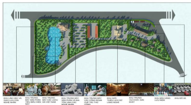
Hình 1. Phối cảnh tổng thể khu chế tác, trưng bày các sản phẩm của làng nghề truyền thống đá mỹ nghệ Non Nước

Qua quá trình khảo sát thực địa, tác giả cho rằng vị trí xây dựng khu chế tác, trưng bày nên ở khu đất phía Bắc đường Huyện Trần Công Chúa và Hoàng Sa. Bởi đây là vị trí thuận lợi nhất để liên kết khách tham quan Danh thắng Ngũ Hành Sơn và Làng nghề truyền thống đá mỹ nghệ Non Nước. Tại khu chế tác, trưng bày nên được xây dựng 8 hạng mục cơ bản (Hình 1).