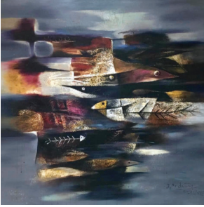
"Nguồn nước chết" - Sơn đầu 150 x 150