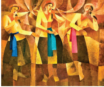
"Khúc hát cần cù" - Sơn đầu 160 x 130