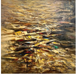
"Góc biển chết" - Sơn đầu 140 x 140 (TL Mỹ thuật toàn quốc năm 2023)

BCH, các chuyên tâm, làm việc với BCH Hội của lãnh đạo tỉnh là minh chứng cho điều tốt. Trước hết là do ông làm việc tốt, có uy tín. Lãnh đạo tỉnh Phó Thọ lại luôn trân trọng và đánh giá cao vai trò của văn nghệ sỹ. Không có sự đố kỵ hẹp hòi, khiêm tốn và luôn là người quảng giao. Ông Ngọc Dũng đã tranh thủ thuận lợi ấy có thêm nhiều điều kiện xây dựng cơ sở vật chất cho Hội, xin quỹ đầu tư sáng tác cho Hội, chăm lo đời sống tinh thần, vật chất cho cán bộ hội viên, nhân viên văn phòng. Nhờ đó mà Hội Liên hiệp VHNT Phú Thọ không ngừng được củng cố và phát triển, trở thành một trong những Hội tiêu biểu của cả nước.