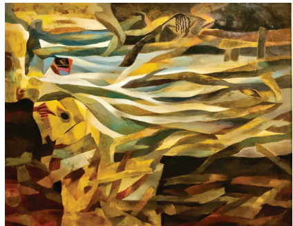
"Tiếng than của đại ngàn" - Sơn dầu 180 x 150 (Giấy A TL Mỹ thuật KV III - Hội Mỹ thuật Việt Nam)