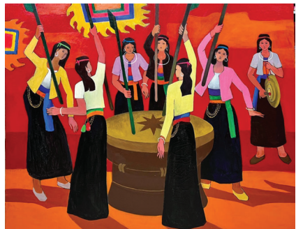
"Nhịp trống đồng" - Sơn dầu 140 x 120

Thật khó có văn nghệ sỹ nào làm quản lý ở Phú Thọ được lãnh đạo tỉnh và Trung ương tin tưởng và quý mến như ông. Sự xuất hiện những lãnh đạo chủ chốt của tỉnh, của Trung ương tại các kiện của