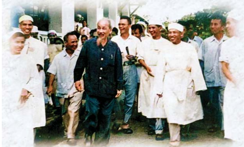
Bác Hồ thăm Bệnh viện Nam Định (1963)