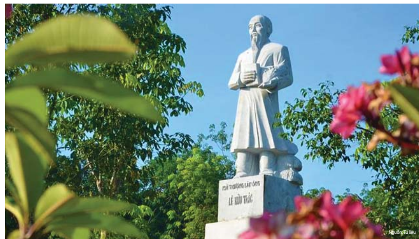
Hải Thượng Lãn Ông - tấm gương sáng về y đức, y thuật

Ở Lê Hữu Trác toát lên nhân cách người Thầy thuốc vĩ đại. Di sản mà ông để lại cho hậu thế thật đồ sộ và quý giá, không chỉ là bộ sách "Hải thượng y tông tâm lĩnh" - cuốn sách gối đầu giường