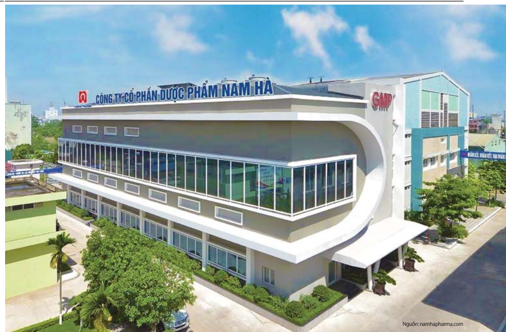
Công ty CP Dược phẩm Nam Hà - Một trong những công ty dược phẩm hàng đầu của Việt Nam

T heo đó, mục tiêu chung là phát triển ngành Dược Việt Nam ngang tầm các nước tiên tiến trong khu vực, đảm bảo tiếp cận thuốc cho người dân với mức chi phí hợp lý; nâng cao năng lực nghiên cứu và ứng dụng công nghệ sản có để sản xuất thuốc biệt dược gốc, thuốc có dạng bào chế mới, hiện đại, hướng tới trở thành trung tâm sản xuất gia công/chuyển giao công nghệ các thuốc biệt dược gốc của khu vực ASEAN, phấn đấu phát triển nền công nghiệp dược