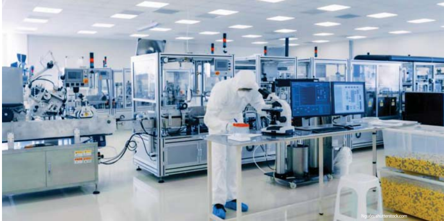
Phát triển ngành Dược Việt Nam ngang tầm các nước tiên tiến trong khu vực.