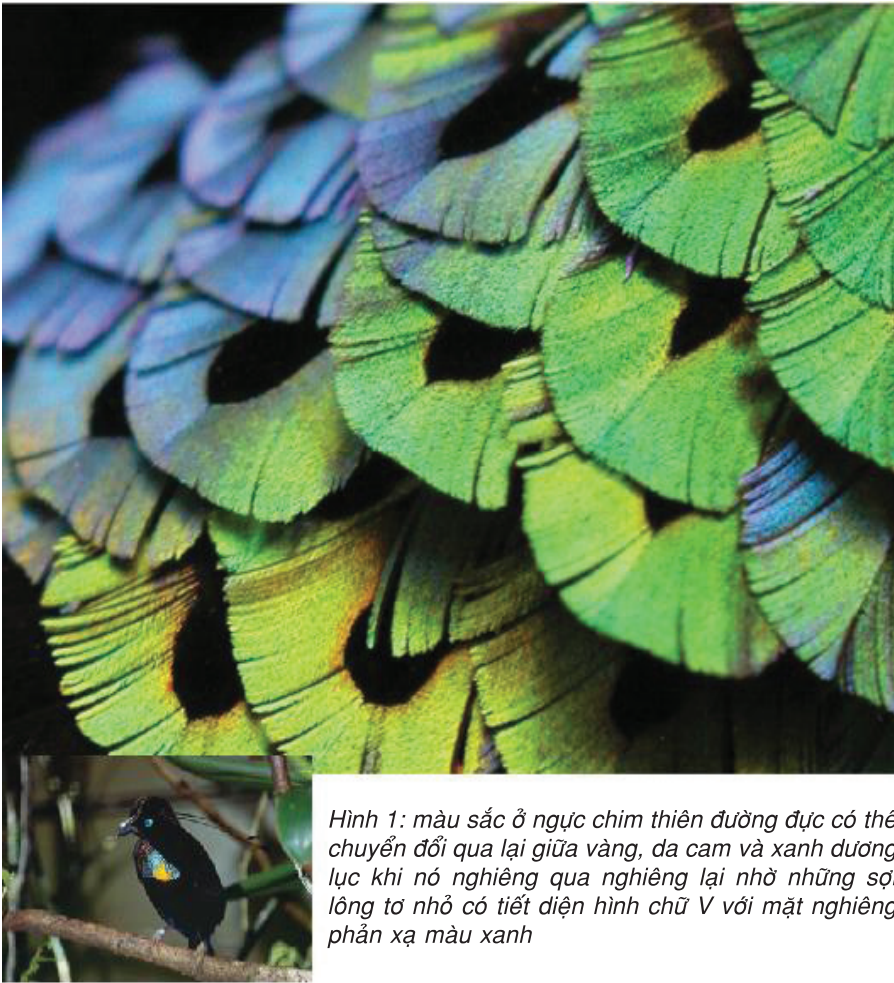
Hình 1: màu sắc ở ngực chim thiên đường đục có thể chuyển đổi qua lại giữa vàng, da cam và xanh dương lục khi nó nghiêng qua nghiêng lại nhờ những sợi lông tơ nhỏ có tiết diện hình chữ V với mặt nghiêng phản xạ màu xanh

nhiều sản phẩm, từ kính viễn vọng đến laser rắn. Năm 2010, Docke G. Stavenga ở Đại học Groningen (Hà Lan) đã phát hiện chim thiên đường đục (tên là Parotia lawesii ) có thủ thuật tạo màu kép (hình 1). Lông tơ ở ngực của loài chim này có những lớp melanin cách nhau, tạo ra phản xạ màu vàng - da cam. Nhưng mỗi sợi lông tơ nhỏ như sợi tóc này có tiết diện ngang hình chữ V với mặt nghiêng phản xạ màu xanh. Lúc tỏ tình với chim mái, chim trống hơi nghiêng qua nghiêng lại, màu sắc của ngực chim thay đổi qua lại giữa vàng, da cam và xanh dương lục giúp chinh phục chim mái. Các nhà công nghệ còn chưa bắt chước được hiệu ứng này nhưng