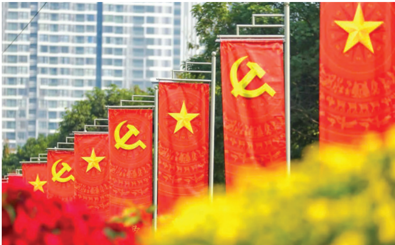
Hiện thực hóa mục tiêu đến năm 2045 đưa Việt Nam trở thành nước phát triển, thu nhập cao là một thách thức rất lớn.