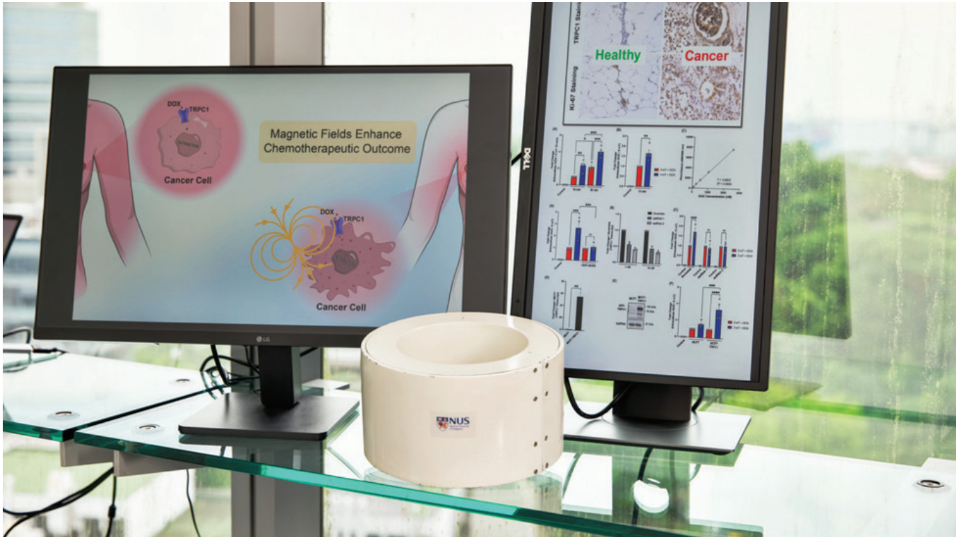
Liệu pháp mới hỗ trợ điều trị ung thư.