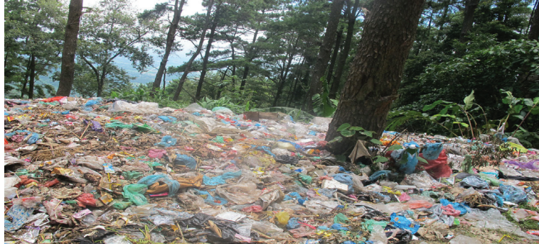
CTR đổ ra những bãi đất lộ thiên gây mất vệ sinh môi trường