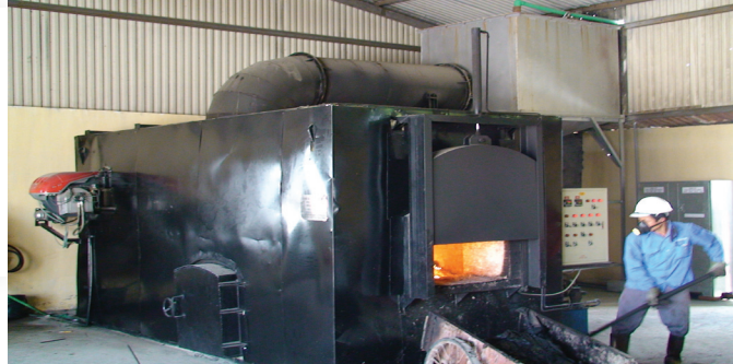
Xử lý CTR bằng lò đốt đang là biện pháp chủ yếu, tuy vẫn phát thải ra nhiều khí thải độc hại

Qua quá trình điều tra, khảo sát, nghiên cứu đánh giá hiện trạng phát sinh và quản lý CTR trên địa bàn khu vực