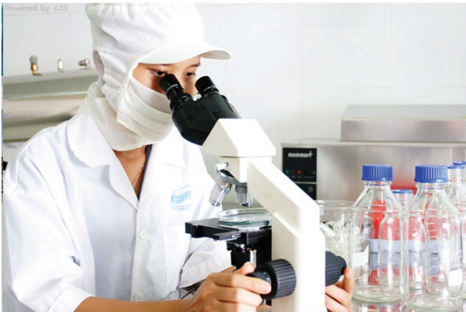
Nghiên cứu khoa học tại Baseafood

Công ty cổ phần Việt - Séc được công nhận là doanh nghiệp KH&CN trên cơ sở đi sâu nghiên cứu thiết kế, chế tạo tàu thuyền từ vật liệu mới PPC (Polypropylene Polystone Copolymer) phù hợp với điều kiện Việt Nam. Sản phẩm của Công ty đã được trao Huy chương vàng tại Hội chợ công nghệ và thiết bị quốc tế Việt Nam 2012. Hiện nay sản phẩm của Công ty đang được sử dụng trong lực lượng hải quân và cảnh sát biển Việt Nam.