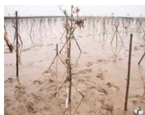
Hình 5: hình dạng và kết cấu của cọc nhựa giữ cây

Sử dụng cọc nhựa giữ cây: trong giai đoạn đầu trồng cây ngập mặn, để bảo vệ cây khỏi bị sóng và dòng chảy ven bờ tác động làm đổ hoặc nghiêng cây, việc sử dụng cọc giữ cây trong giai đoạn đầu là rất quan trọng (hình 5).