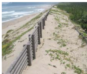
Hình 6: tường mềm bằng gỗ tạo cơ trồng cây trên cồn cát

với hàng cọc, san cát trên dốc mái xuống tường rào nêu trên tạo thành các cơ dạng bậc thang trên cồn cát để trồng cây (hình 6).