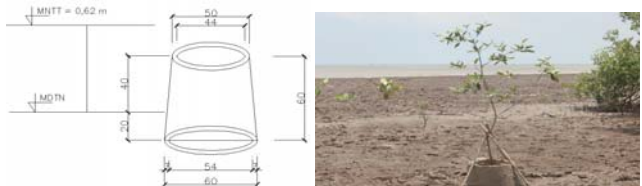
Hình 4: hình dạng và kết cấu bầu bê tông cốt xenlulo

Sử dụng đại cây tiên phong tầng tán thấp có bầu chịu sóng: trường hợp sóng lớn, tường mềm giảm sóng đã được thiết kế với hệ số giảm sóng (R) tối đa, nhưng chiều cao sóng sau tường mềm (Hst) vẫn lớn hơn 0,4 m thì phải thiết kế đại cây có bầu chịu sóng, với kết cấu là bê tông cốt xenlulo hoặc bê tông vỏ mỏng hoặc bầu nhựa polyetylen tùy theo mức độ chịu sóng (xem hình 4).