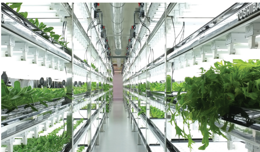
Trang trại rau sạch cao cấp tại Yokosuka, Nhật Bản

thông tin KH&CN quốc gia (NIST) để hiện đại hóa các kỹ thuật xử lý thông tin đạt trình độ quốc tế. Đến năm 1988, JICST đã có một cơ sở dữ liệu có khả năng xử lý 580.000 thông tin một năm, thông tin được thu thập từ hơn 50 nước (khoảng 7 triệu thư mục), cung cấp thông tin trực tuyến cho khách hàng trong và ngoài nước. Đặc biệt, JICST tiếp tục thu thập thông tin từ 11.000 ấn phẩm KH&CN trong nước và 12.000 ấn phẩm nước ngoài... Với sự phát triển ngày càng mạnh mẽ của nền KH&CN quốc gia, Nhật Bản càng chú trọng đặc biệt vào nguồn lực thông tin KH&CN. Nhật Bản cho rằng thông tin chính là nguồn lực không thể thiếu đối với an ninh quốc gia, và để hội nhập được với nền KH&CN thế giới, Nhật Bản sẽ cố gắng đóng góp cho cộng đồng quốc tế thông qua việc cung cấp thông tin KH&CN.