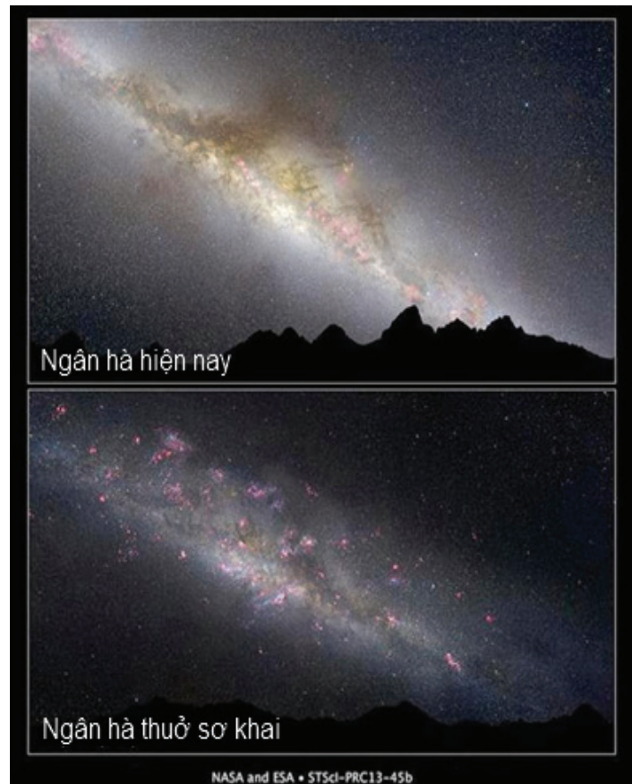
Hình 1: ngân hà hiện nay và thuở sơ khai