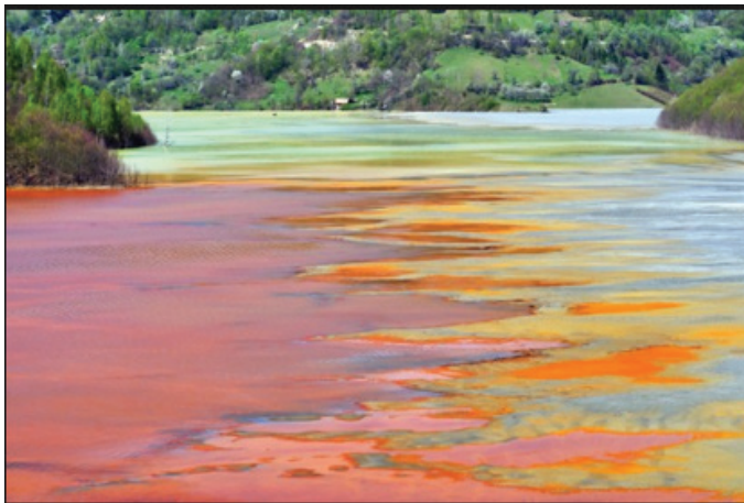
Hình 1: ô nhiễm nước thải dệt nhuộm - vấn nạn môi trường của nền công nghiệp hiện đại

Ngày nay, phẩm nhuộm hữu cơ đã trở thành một trong những nguồn ô nhiễm chính đối với nước thải công nghiệp. Với đặc điểm chứa các vòng hữu cơ hương thơm không thể phân hủy, chúng đang được xem là những tác nhân không chỉ độc hại đối với sức khỏe con người, thậm chí gây ung thư mà còn gây ra những ảnh hưởng tiêu cực đến môi trường sinh thái (hình 1). Vì vậy xử lý nước thải dệt nhuộm luôn là nhu cầu cấp thiết, được quan tâm trên toàn thế giới. Một trong những kỹ thuật loại bỏ phẩm nhuộm trong nước thải hiệu quả nhất là sử dụng chất hấp phụ, nhờ vào tính đơn giản trong vận hành của kỹ thuật này, tính hiệu quả cao và dễ dàng thích ứng với các đối tượng xử lý khác nhau [1, 2].