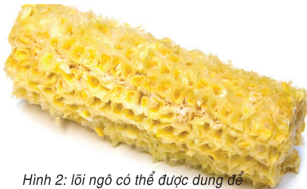
Hình 2: lõi ngô có thể được dùng để tổng hợp vật liệu hấp phụ chất ô nhiễm hiệu quả

Xuất phát từ những ghi nhận trên, nhóm nghiên cứu thuộc Khoa Khoa học cuộc sống, Đại học Nông nghiệp Anhui (Trung Quốc), dẫn đầu bởi Tiến sĩ Huan Ma [14] đã đề nghị phát triển một phương pháp đơn giản và rẻ tiền để tổng hợp chất hấp phụ từ tính chứa carbon từ lõi ngô, một sản phẩm sinh khối thải chứa nhiều lignocellulose (hình 2) dưới điều kiện thủy nhiệt nhiệt độ thấp. Phương pháp này dựa trên quá trình carbon hóa thủy nhiệt lõi ngô trong môi trường muối để sản xuất vật liệu carbon. Sản phẩm sau đó được trải qua giai đoạn từ hóa thủy nhiệt bằng cách sử dụng muối sắt (III) để thu được chất hấp phụ có từ tính.