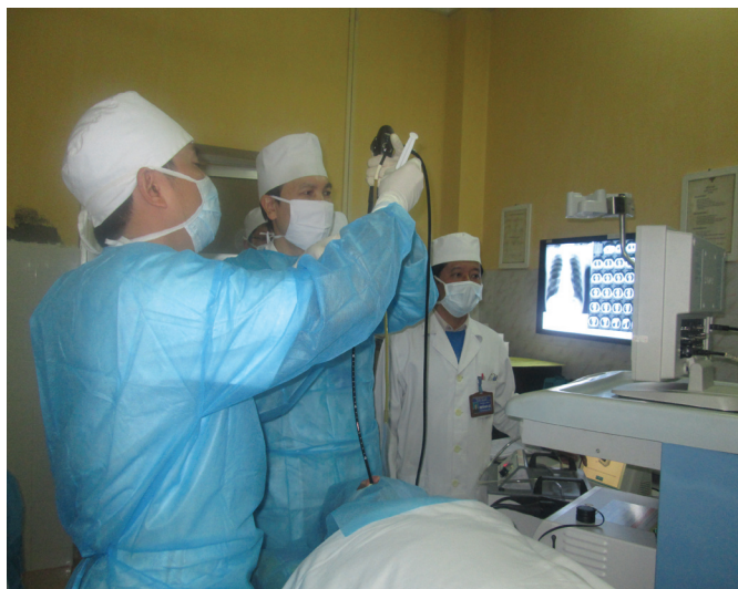
Thực hiện kỹ thuật nội soi đặt van phế quản