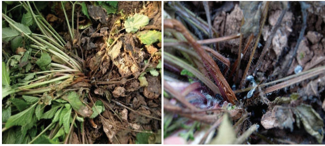
Hình 1: triệu chứng bệnh thối gốc đan sâm: a. Gốc thân bị thối; b. Hạch nấm hình thành ở gốc thân bị bệnh

Tác nhân gây bệnh: nấm R. solani là tác nhân chính được phân lập từ các mẫu bệnh và hạch nấm thu được từ các cây đan sâm bị thối gốc trên ruộng (hình 2). Sau khi lây bệnh 5 ngày, 12 trong số 15 cây đan sâm lây bệnh đều biểu hiện triệu chứng điển hình của bệnh thối gốc, trong khi các cây đối chứng đều không biểu hiện triệu chứng bệnh. Kết quả tái phân lập mẫu bệnh chỉ thu được một loài nấm duy nhất là R. solani . Kết quả này khẳng định, nấm R. solani chính là tác nhân gây bệnh thối gốc cây đan sâm.