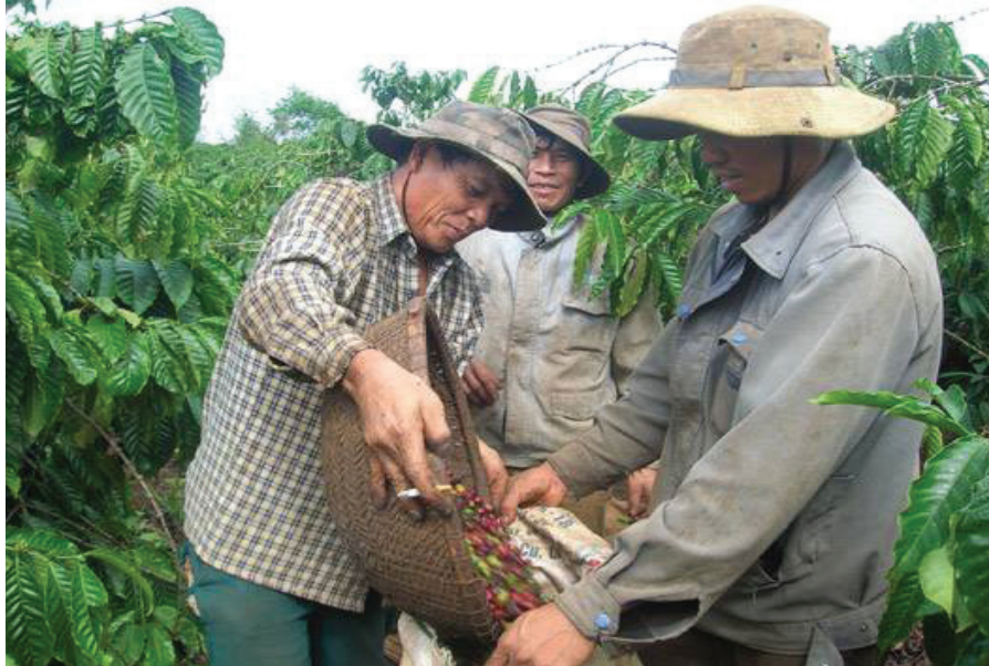
Hộ thành viên của HTXNN công bằng Thuận An thu hái cà phê.

Lấy ví dụ, Tổ chức Thương mại công bằng thế giới (World Fair Trade Organization - WFTO) không thể hợp tác với hơn 50 hộ gia đình trên địa bàn tỉnh Đắk Nông để sản xuất và xuất khẩu cà phê đạt chứng nhận Fair Trade. Nhưng thông qua hoạt động của HTXNN công bằng Thuận An, sản phẩm cà phê của hơn 50 hộ gia đình thành viên HTX đã được xuất khẩu ra thị trường quốc tế. Hoặc HTX Anh Đào tỉnh Lâm Đồng ký hợp đồng với Liên hiệp HTX thương mại Sài Gòn (Siêu thị Coop.max) cung cấp ổn định số lượng lớn các loại rau củ quả để đưa vào hệ thống siêu thị trên cả nước. Trên cơ sở nội dung hợp đồng, hàng ngày, tuần, tháng, các HTX đều có kế hoạch cụ thể để các hộ gia đình thành viên sản xuất và cung ứng sản phẩm đúng theo cam kết. Tuy nhiên, Liên hiệp HTX thương mại Sài Gòn sẽ không ký hợp đồng với từng hộ gia đình, vì chỉ có thông qua HTX mới đủ niềm tin và đủ năng lực tổ chức sản xuất đáp ứng được yêu cầu của nhà tiêu thụ. Khi doanh nghiệp ký hợp đồng bao tiêu sản phẩm với HTXNNKM, mặc dù sản phẩm do hộ gia đình thành viên trực tiếp sản xuất, nhưng HTX thực hiện chức năng kiểm soát chất lượng sản phẩm theo yêu cầu của doanh nghiệp đối với tất cả thành viên HTX. Nếu doanh nghiệp ký kết hợp đồng với hàng trăm hộ gia đình mà thiếu vắng