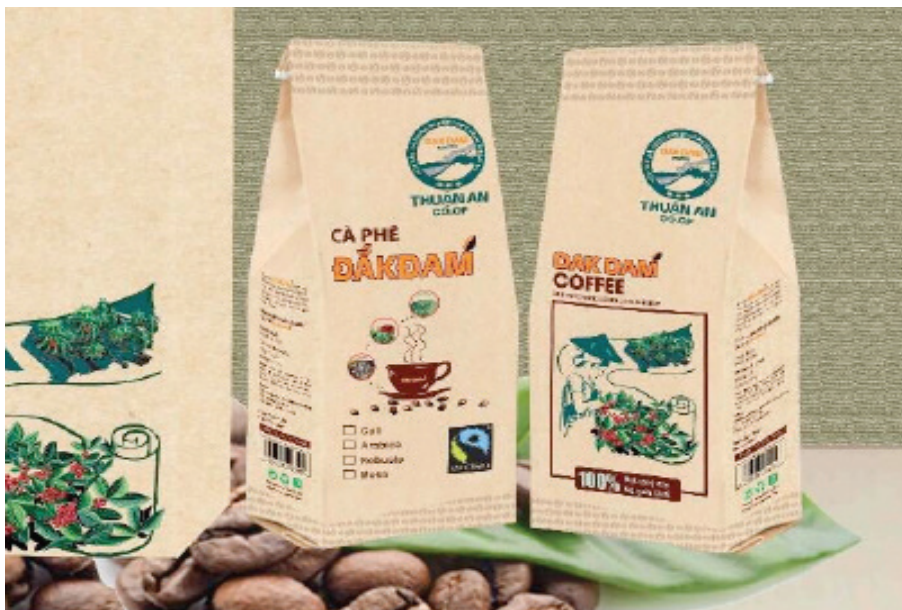
Cà phê ĐắkĐam - Một sản phẩm tiêu biểu của Hợp tác xã theo tiêu chuẩn của WFTO.