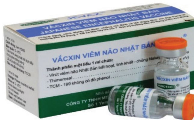
Vắc xin viêm não Nhật Bản.

Vắc xin tả uống: sản phẩm vắc xin tả uống là kết quả của đề tài nghiên cứu cấp nhà nước KY-01-03 “Ứng dụng các kỹ thuật tiến bộ để hoàn thiện quy trình sản xuất vắc xin tả uống” (thuộc Chương trình nghiên cứu cấp nhà nước KY-01 giai đoạn 1991-1995) và dự án sản xuất thử nghiệm cấp nhà nước KH-CN-11-DA “Hoàn thiện quy trình công nghệ sản xuất vắc xin tả uống”. Vắc xin này đã được triển khai tại các vùng trọng điểm có nguy cơ cao và sử dụng để phòng bệnh cho nhân dân trong các đợt bùng phát dịch. Kết quả triển khai trong thực tiễn cho thấy, vắc xin đã phát huy hiệu quả cao, làm giảm đáng kể các đợt bùng phát dịch tả trong cộng đồng.