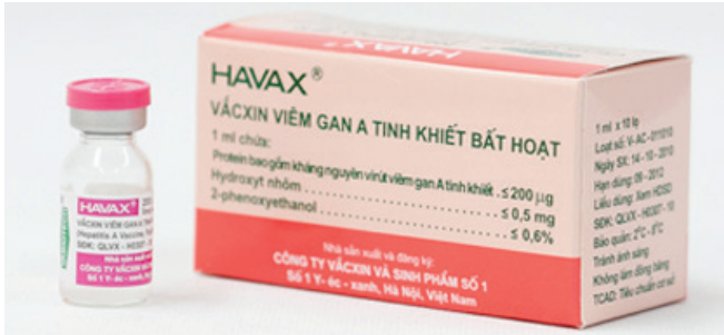
Vắc xin viêm gan A.