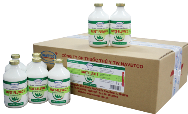
Vắc xin Navet-Fluvac 2.

Dự án được phê duyệt thực hiện từ tháng 12/2017-12/2019, nhưng với sự quyết tâm của cơ quan chủ trì và sự hỗ trợ của các cơ quan quản lý, đơn vị phối hợp, dự án đã được nghiệm thu cấp quốc gia vào nửa cuối năm 2019 với kết quả đạt loại xuất sắc. Cụ thể, dự án đã: i) Hoàn thiện sản xuất vắc xin ở quy mô công nghiệp trên cơ sở kiểm tra, đánh giá độ dài bảo quản của giống sản xuất ở các thời điểm 3, 6, 9 tháng trong điều kiện bảo quản -80°C; hoàn thiện quy trình gây nhiễm trên trứng (tiêm trứng, thu hoạch nước trứng) bằng thiết bị tự động thay thế phương pháp tiêm thủ công; hoàn thiện nâng cao chất lượng nhũ dầu;