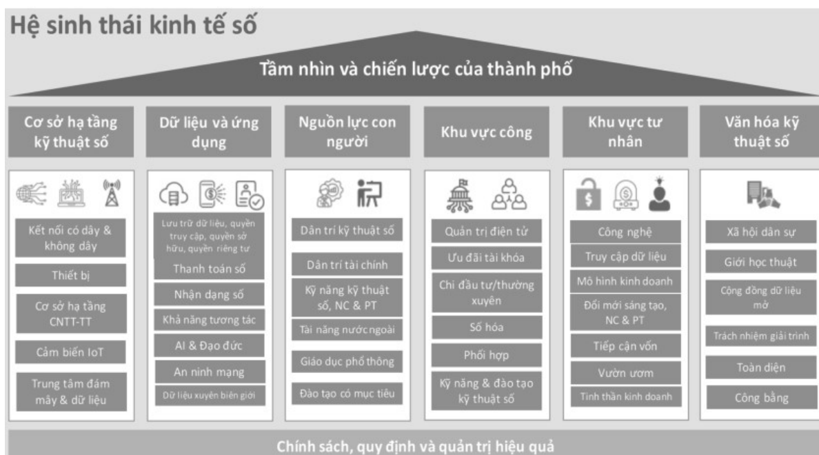
Hình 2: Hệ sinh thái kinh tế số - tầm nhìn và chiến lược của Thành phố Hồ Chí Minh