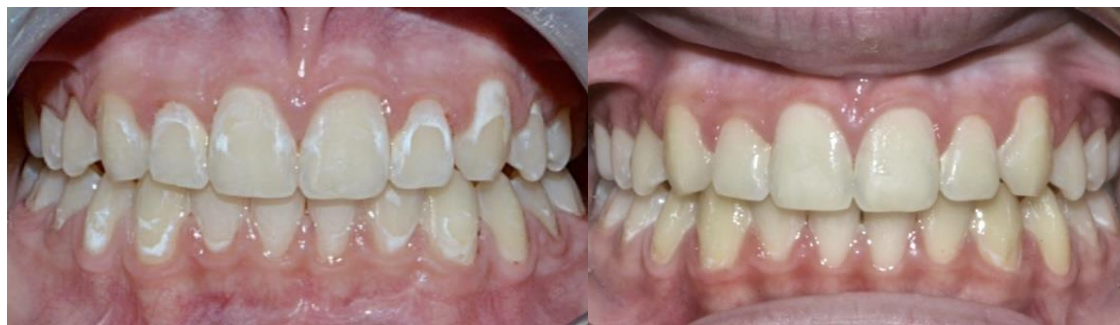
Hình 3,4. Hình ảnh tổn thương đốm trắng trước điều trị (trái) và sau điều trị (phải)