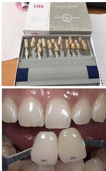
Hình 1,2: Bảng so màu răng VITA Classic và cách so màu răng

Quy trình nghiên cứu: Chọn bệnh nhân – khám phát hiện tổn thương – Chụp ảnh tổn