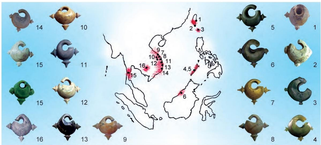
Hình 1. Phân bố của loại hình khuyên tai ba mẫu (lingling-o) ở khu vực

Hình ảnh về bằng chứng sản xuất và phân bố trang sức ở khu vực Đông Nam Á