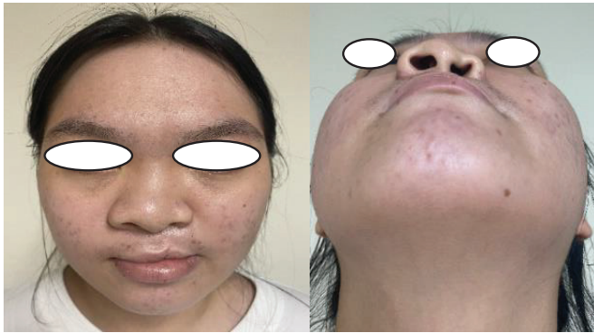
Hình 3. Biến dạng của mũi trên bệnh nhân đã phẫu thuật vá môi trước khi tạo hình mũi.