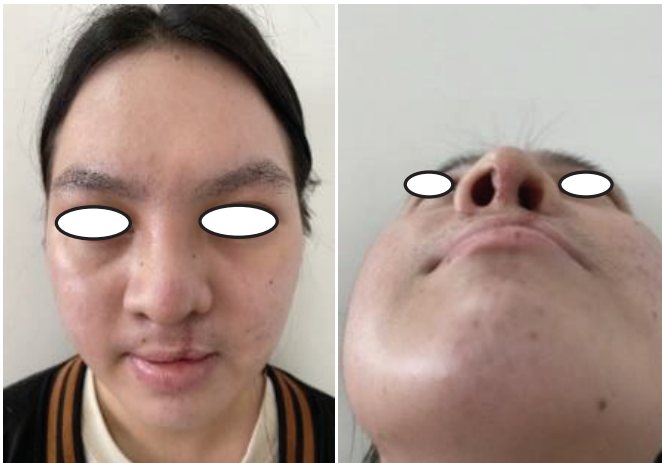
Hình 4. Biến dạng của bệnh nhân được cải thiện sau phẫu thuật.