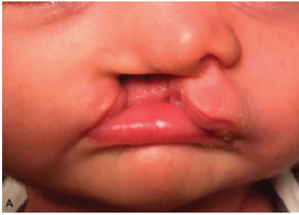
Hình 2. Biến dạng mũi trên bệnh nhân khe hở môi một bên trước khi phẫu thuật vá môi [4].