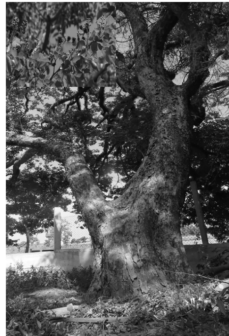
▲ Hình 4. Giáng Hương ấn ( Pterocarpus indicus Willd)

có sự chênh lệch khá cao, trong đó, ngành Ngọc Lan có số lượng loài chiếm 96,55% tổng số loài của cả hệ thực vật.