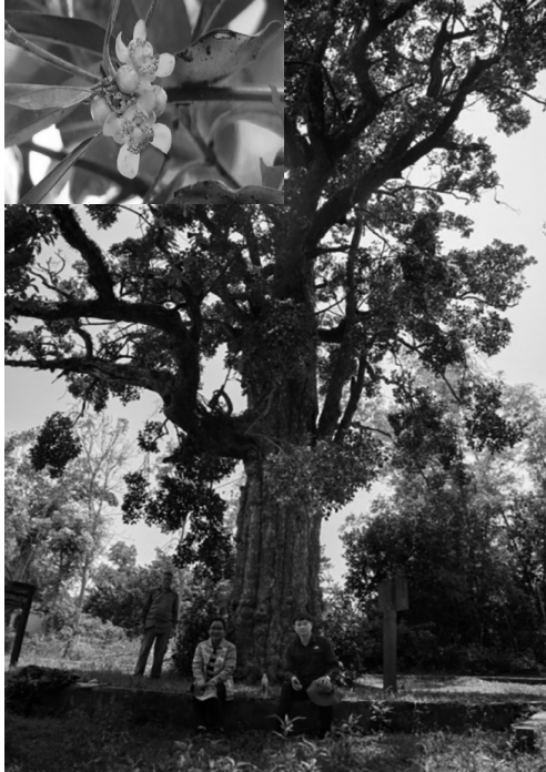
▲ Hình 3. Ròi Mật ( Garcinia celebica L)