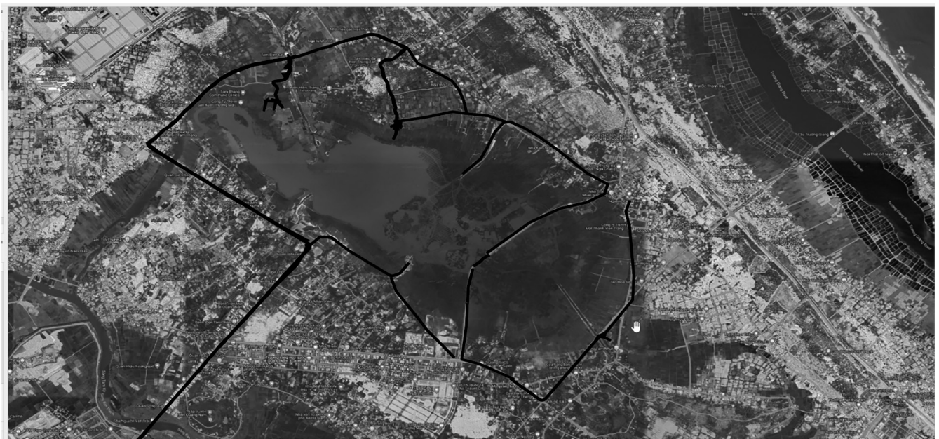
▲ Hình 1. Sơ đồ các tuyến điều tra khảo sát thực vật

Kết quả nghiên cứu thu được tại khu vực sông Đầm có tổng số 232 loài và dưới loài, thuộc 173 chi, 89 họ, thuộc 3 ngành thực vật bậc cao có mạch, gồm: