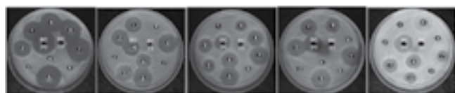
▲ Hình 3. Khả năng kháng VSV gây bệnh kiểm định C. albican , E. coli , B. cereus , P. aeruginosa , S. aureus của các chủng nấm (1. TLC9, 2. TLC10, 3. TLC11, 4. TLC12, 5. TLC13, 6. TLC14, 7. TLC19, 8. TLC20, 9. TLC22, ĐC (-): đối chứng âm, ĐC (+): đối chứng dương)

và 36±1,5 mm ( C. albican ); 2 chủng TLC10 và TLC19 đều có khả năng kháng 4/5 VSV kiểm định, chủng TLC19 kháng mạnh với B. cereus , P. aeruginosa và C. albican ; 4 chủng kháng 3/5 VSV thử nghiệm và chủng chỉ kháng duy nhất 1 loại VSV E. coli là chủng TLC14.