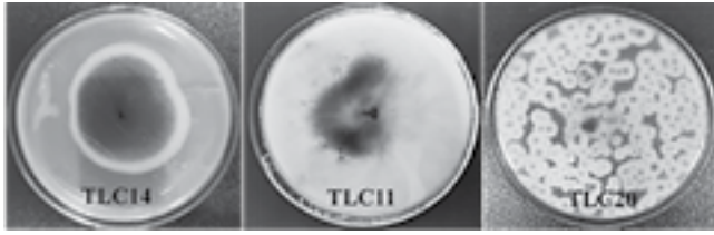
▲ Hình 1. Các chủng nấm có khả năng sinh \beta -galactosidase