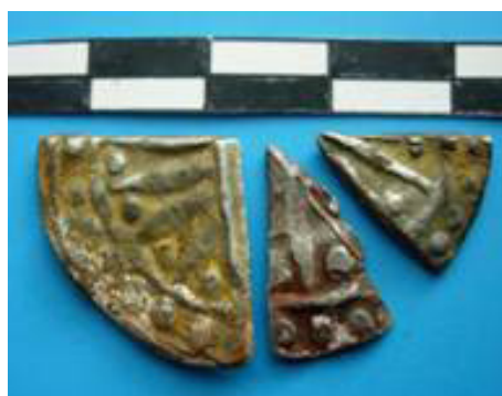
Ảnh 4: Nửa trên và nửa dưới đồng tiền được cắt sẵn (trái)