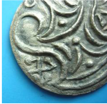
Ảnh 3: Hoa văn chữ Vạn ở mặt sau đồng tiền (rìa trái)

Tóm lại, từ chỉ dẫn này ta thấy mặt sau đồng tiền có sao, có trăng tròn (phía trên), trăng khuyết (phía dưới), có chữ “Vạn” với 4 nan hoa, có cả khúc củi bất chéo trong lễ hiến tế Veda cổ, đối xứng hai bên còn có đường cong ôm lấy chữ “Vạn” và hoa văn bất chéo mà có người gọi là “cửa võng”, vì thế có lẽ tập hợp các hoa văn này biểu thị ngôi đền Hindu giáo chứ không phải chùa thờ Phật, càng không phải là “mũi thuyền”.