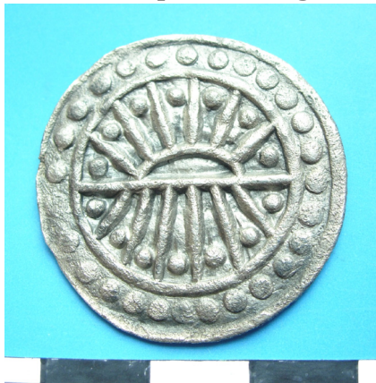
Ảnh 1a: Mặt trước đồng tiền Phù Nam bằng hợp kim bạc

Ảnh 1a là mặt trước, ảnh 1b là mặt sau đồng tiền (mà các nhà nghiên cứu nói trên đề cập) có đường kính D=30mm.