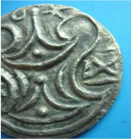
Ảnh 2: Hai đường nổi bất chéo ở mặt sau đồng tiền (rìa phải)

chéo trong lễ hiến tế Veda cổ... mặc dù thần Shiva đặc biệt liên kết với biểu tượng mặt trăng, song chữ “Vạn” cũng đã trở nên phổ biến trong các biểu tượng của phái Shavite (tức giáo phái Shiva - PHTB)... chữ “Vạn” có thể quay sang trái, sang phải. Phụ nữ gắn chữ “Vạn” quay sang trái đại để được xem là gặp bất hạnh. Đức quốc xã thừa nhận chữ “Vạn” quay sang phải do họ kết hợp với sắc tộc Aryan, gắn với kỳ vọng hướng tới việc thuần chủng hóa dân tộc cổ xưa. Tín đồ Ấn giáo và Phật giáo tiếp tục sử dụng biểu tượng này trong nhiều lĩnh vực...” (4)