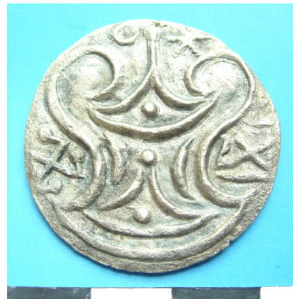
Ảnh 1b: Mặt sau đồng tiền Phù Nam bằng hợp kim bạc