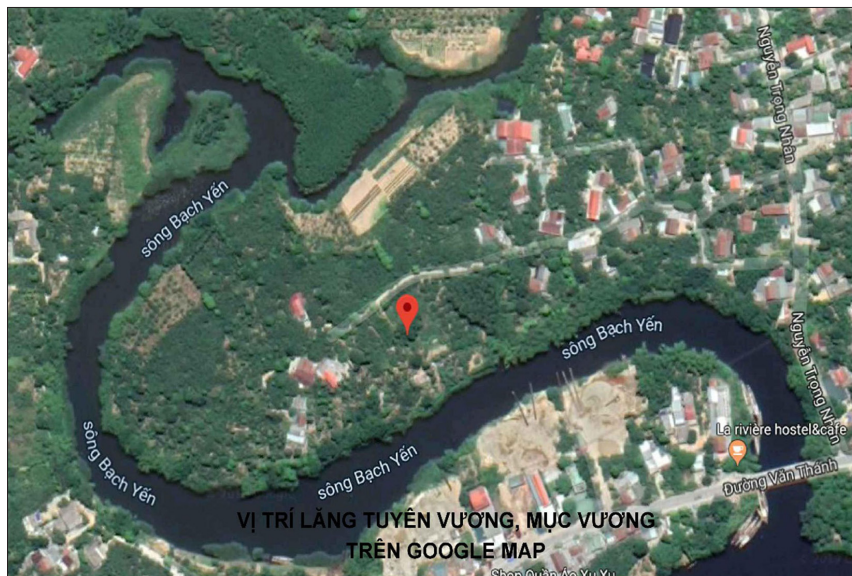
Hình 1: Vị trí làng mộ Tuyên Vương, Mực Vương trên Google map.

Tả mộ Tuyên Vương, Mực Vương được xây dựng trên cùng một địa điểm nhưng trong khoảng thời gian khác nhau, cụ thể là cách nhau gần 50 năm. Lựa chọn vị trí xây dựng tả mộ cho nhị vị Vương, các nhà kiến trúc sư vào thời điểm đó hoàn toàn tuân thủ quan điểm về thuật phong thủy. Hai ngôi mộ này được bao bọc bởi con sông Bạch Yến (chi lưu Sông Hương), xa xa là những dãy đồi núi trùng điệp với chức năng tiền án, che chắn vững chãi vô cùng.