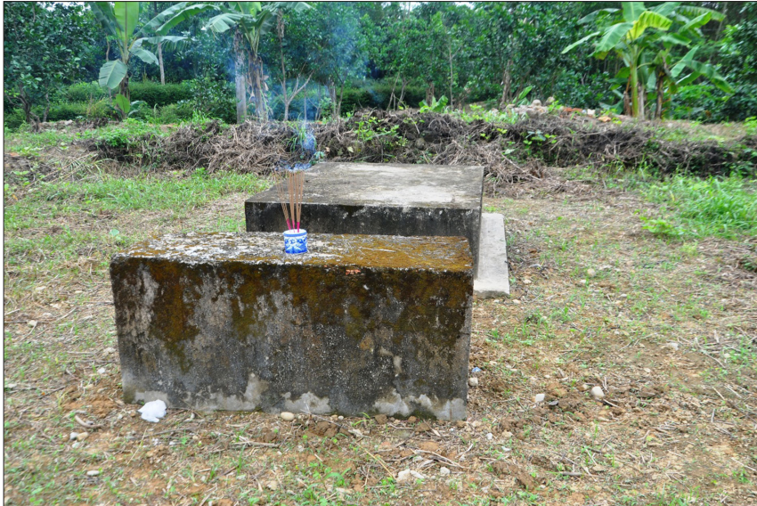
Hình 4: Hiện trạng tẩm mộ Mục Vương.

Tẩm mộ Mục Vương nằm về phía bên phải (từ trong nhìn ra), có bình đồ hình chữ nhật, bao gồm hai vòng thành (thành nội, thành ngoại), (nội phương - ngoại phương), với tổng chu vi là 79,6m 2 , bao gồm các đơn nguyên kiến trúc: bình phong tiền, án thờ, tẩm mộ.