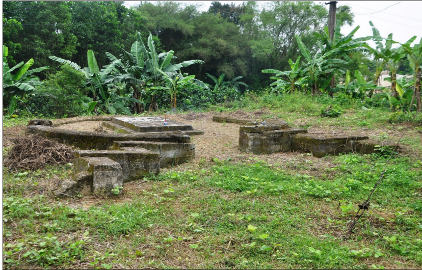
Hình 2: Tổng thể tấm mộ Tuyên vương.

Nấm mộ lăng Tuyên Vương có kiểu mộ hình chữ nhật (sàng hình), với hai tầng xây dựng bằng vôi vữa, phía trước không có hương án. Trong đó, kích thước tầng trên với chiều dài 273,2cm; chiều rộng 171cm; chiều cao 16,2cm. Tầng dưới có kích thước: chiều dài 324cm; chiều rộng 222cm; chiều cao 27cm. Theo một số người dân nơi đây, sau năm 1975, tấm mộ Tuyên Vương đã bị một số kẻ gian đào trộm, lấy đi rất nhiều đồ tùy táng.