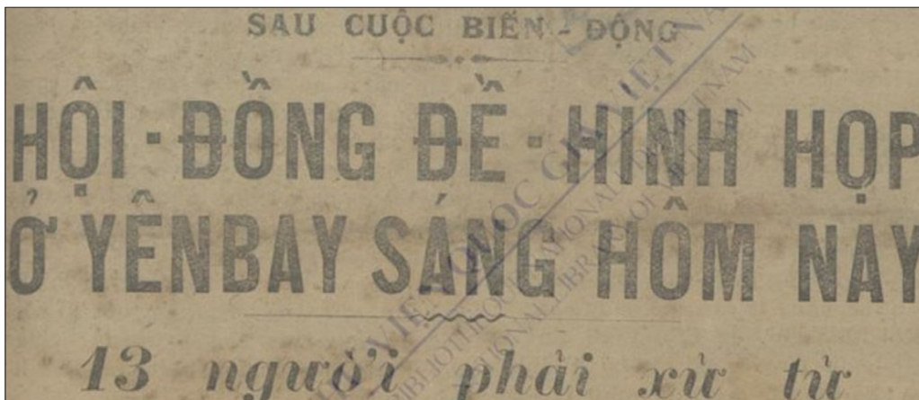
Hà thành Ngọ báo ngày 28 tháng Hai, 1930, tr. 1.