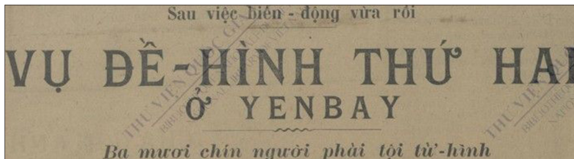
Hà thành Ngọ báo ngày 29 tháng Ba, 1930, tr. 1. Nguồn: Thư viện Quốc gia Việt Nam.

HĐĐH Yên Bái 2 đã tuyên 39 án tử hình, trong danh sách án này (1, 29/3/1930), không có ai tên là Thinh/Thịnh . Có hai người cùng bị án tử, tên gần nhau là Tin/Tín và Tinh/Tính nhưng không dễ bị lẫn lộn: Tin/Tín là thường dân, Tinh/Tính là quân nhân. Tinh/Tính ít khả năng được ân xá hơn vì mưu giết nhiều sĩ quan Pháp cấp trên. (13) Người đã được giảm án chắc là Tin/Tín .