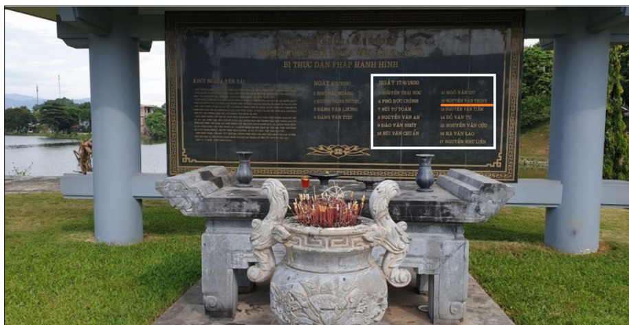
Bia tường niệm tại Di tích Nguyễn Thái Học ở Thành phố Yên Bái.