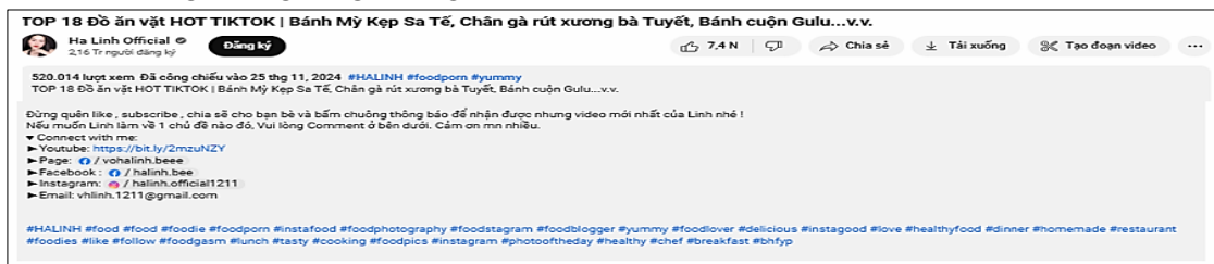
Hình 1. Ví dụ về hashtag trong diễn ngôn review đồ ăn của kênh YouTube Hà Linh Official

Từ 200 bài viết, tổng cộng 1.670 hashtag được trích xuất, bao gồm: 416 hashtag thuộc lĩnh vực âm nhạc, 412 thuộc phim ảnh, 423 thuộc ẩm thực và 419 thuộc du lịch. Ví dụ, chuỗi hashtag trong một bài review đồ ăn vặt bán chạy trên TikTok của kênh YouTube Hà Linh Official (#halinhreview, #anvatcungTikTok, #anthuhetmenuchia) minh hoạ cách người dùng đồng thời gắn nhãn nội dung, bày tỏ thái độ và kêu gọi cộng đồng tham gia.