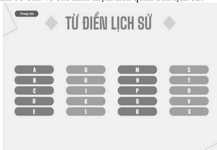
Hình 3. Site từ điển lịch sử trong website “Trạm dừng Lịch sử số 8”

Thứ 3, phần “Site từ điển lịch sử” là công cụ giáo dục giúp học sinh tra cứu thông tin lịch sử nhanh chóng, chính xác và dễ tiếp cận. Trang web này tổ chức nội dung theo bảng chữ cái từ A đến X, mỗi ký tự đại diện cho một nhóm thuật ngữ hoặc khái niệm lịch sử. Từ điển không chỉ cung cấp định nghĩa ngắn gọn mà còn khái quát các yếu tố lịch sử, giúp người dùng có cái nhìn cơ bản về các khái niệm liên quan đến lịch sử.