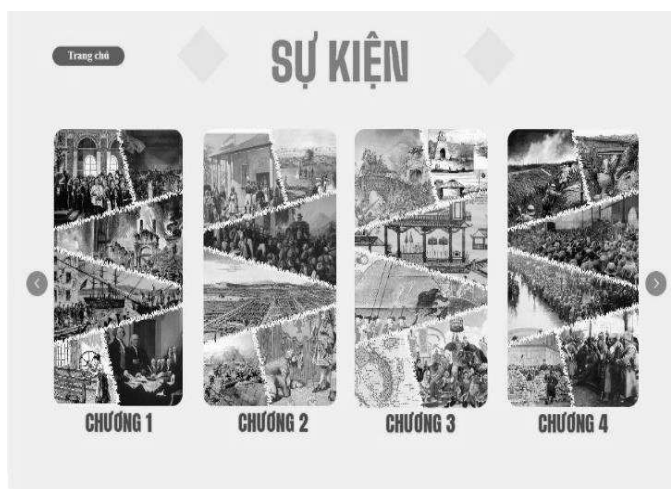
Hình 2. Site sự kiện lịch sử trong website “Trạm dừng Lịch sử số 8”

Website xây dựng ba chương chính: Chương 1 về cuộc cách mạng tư sản và công nghiệp ở Châu Âu và Bắc Mỹ từ thế kỷ XVI đến XVIII, Chương 3 về lịch sử Việt Nam từ thế kỷ XVI đến XVIII, đặc biệt là giai đoạn Nam – Bắc triều, Trịnh – Nguyễn phân tranh, và Chương 7 về lịch sử Việt Nam từ thế kỷ XIX đến đầu thế kỷ XX, tập trung vào thuộc địa hóa, kháng chiến và cải cách xã hội. Giao diện của website sử dụng tông màu ấm (be và đỏ) với hình ảnh minh họa từ tranh và tài liệu, giúp học sinh dễ dàng ghi nhớ và tạo cảm giác chân thực. Bố cục các chương rõ ràng, với các nút điều hướng thuận tiện, dễ dàng di chuyển giữa các nội dung.