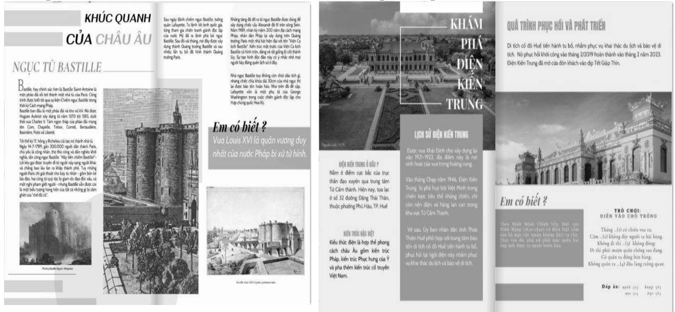
Hình 5. Nội dung Tạp chí lịch sử trong website “Trạm dừng Lịch sử số 8”

Tạp chí lịch sử thế giới khai thác các chủ đề như cung điện Versailles, nhà tù Bastille, phát minh của James Watt, và các câu chuyện văn hóa nổi tiếng. Tạp chí lịch sử Việt Nam tập trung vào các sự kiện và nhân vật lịch sử Việt Nam, như Lê Quý Đôn, Nguyễn Trường Tộ, cùng với các di tích và lễ hội văn hóa. Ngoài ra, tạp chí cũng tích hợp trò chơi tương tác như xếp chữ, tìm từ và mục "Em có biết?" để làm học tập thêm phần thú vị.