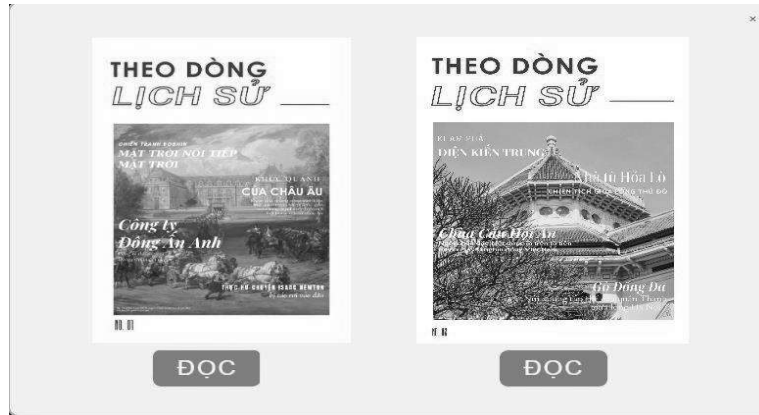
Hình 4. Tạp chí lịch sử trong website “Trạm dừng Lịch sử số 8”

Tạp chí lịch sử thế giới khai thác các chủ đề như cung điện Versailles, nhà tù Bastille, phát minh của James Watt, và các câu chuyện văn hóa nổi tiếng. Tạp chí lịch sử Việt Nam tập trung vào các sự kiện và nhân vật lịch sử Việt Nam, như Lê Quý Đôn, Nguyễn Trường Tộ, cùng với các di tích và lễ hội văn hóa. Ngoài ra, tạp chí cũng tích hợp trò chơi tương tác như xếp chữ, tìm từ và mục "Em có biết?" để làm học tập thêm phần thú vị.