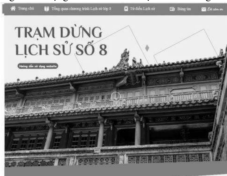
Hình 1. Trang chủ trong website "Trạm dừng Lịch sử số 8"

Đầu tiên, Site trang chủ của website sẽ cung cấp cho học sinh về Tổng quan chương trình Lịch sử lớp 8 để học sinh có thể nắm rõ được các kiến thức, mục tiêu môn tác giả đã tạo thêm 1 site "Hướng dẫn sử dụng website" để cho học sinh dễ dàng sử dụng web hơn.