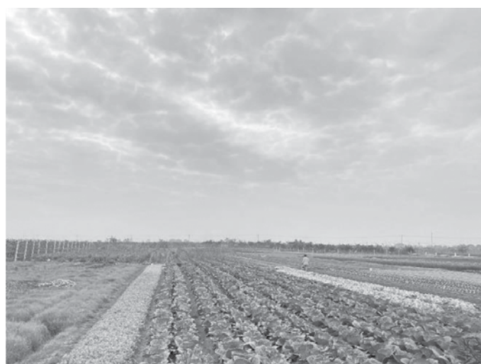
Cảnh quan dân cư và đồng ruộng (đình Giẽ Hạ xã Phú Yên và đồng ruộng xã Quang Lăng)