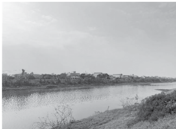
Cảnh quan ven sông Nhuệ khá đơn điệu