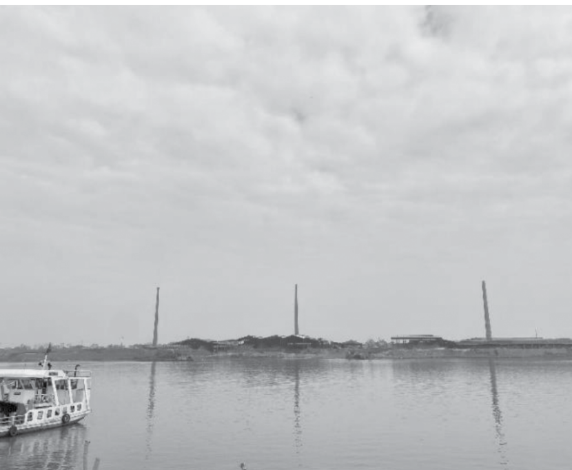
Cảnh quan ven sông Hồng

Mặt nước hồ, ngòi, đầm có vai trò quan trọng tạo cảnh quan đặc trưng cho vùng huyện. Trong số 139,1ha mặt nước với 53 hồ có tới 12 hồ gắn với đình, chùa, đền tạo nên cảnh quan mặt nước đặc trưng của khu vực làng xã. Tuy nhiên huyện cũng chưa có khu vực mặt nước lớn, hồ lớn nhất cũng dưới 7ha.