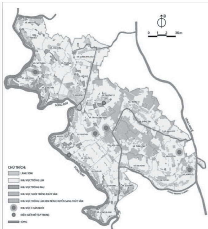
Sơ đồ hệ thống sông, kênh mương chính