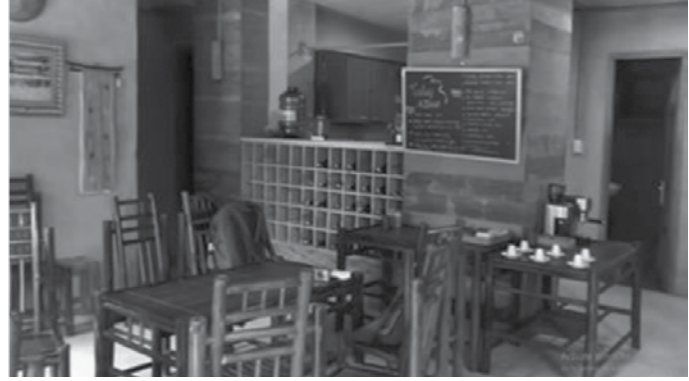
Hình 4: Homestay thôn Nậm Dăm - KTS Hoàng Thúc Hào

bởi một ngôi nhà kiên cố nhưng không gian kiến trúc không phù hợp với thói quen sinh hoạt của người dân sẽ dần dần làm người dân từ bỏ hoặc họ sẽ tự dựng cho mình một ngôi nhà kiểu truyền thống bên cạnh những ngôi nhà kiên cố được dựng mà không phù hợp. Trong trường hợp khác họ có thể coi nói, mở rộng diện tích sinh hoạt, thay đổi không gian bên trong.