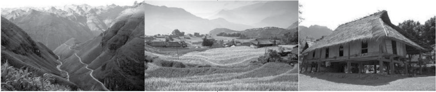
Hình 1: Các yếu tố kiến trúc cảnh quan đặc trưng miền núi phía Bắc

xa xôi, kinh tế chậm phát triển, sau bao năm, kiến trúc cảnh quan vùng này ít có sự biến đổi. Tuy nhiên, thời gian gần đây, dưới sức ép của kinh tế thị trường cùng các kế hoạch phát triển kinh tế xã hội vùng cao của Chính phủ, nguy cơ về sự “biến mất” của nền văn hóa đặc sắc các dân tộc ít người đang dần hiện hữu. Do vậy, cần có nghiên cứu, đề xuất giải pháp tổ chức không gian kiến trúc cảnh quan kế thừa các giá trị văn hóa truyền thống gắn với nhiệm vụ quy hoạch nông thôn mới.