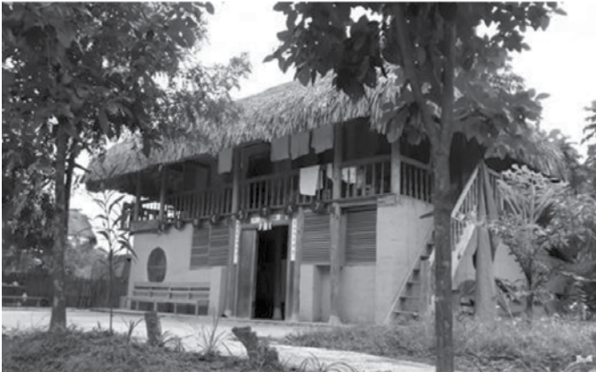
Hình 2: Homestay thôn Nậm Dăm

Không gian cộng đồng: Các suối nước, mỏ nước để lấy nước ăn và sinh hoạt bị cạn hoặc ô nhiễm, không còn là địa điểm mọi người lui đến thường xuyên để gặp gỡ, giao lưu, chuyện trò. Khu rừng thiêng - nơi diễn ra một số hoạt động tôn giáo tín ngưỡng vốn là rừng tự nhiên nay bị chặt phá, khai thác cũng giảm đi tính “thiêng” đối với bản làng. Tục lệ tổ chức hội họp ở nhà trưởng bản, tổ chức lễ hội ở bãi đất đồi, ruộng nương vẫn được duy trì.