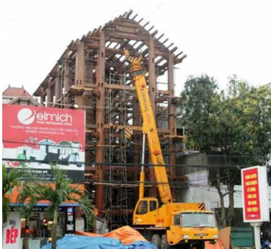
Một kiểu “truyền thống hóa” theo phương thức “nhại cổ” tại Hà Tĩnh