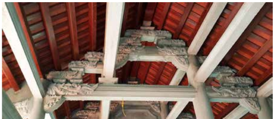
Bộ vì kèo gỗ nhà truyền thống được giả bằng bê tông