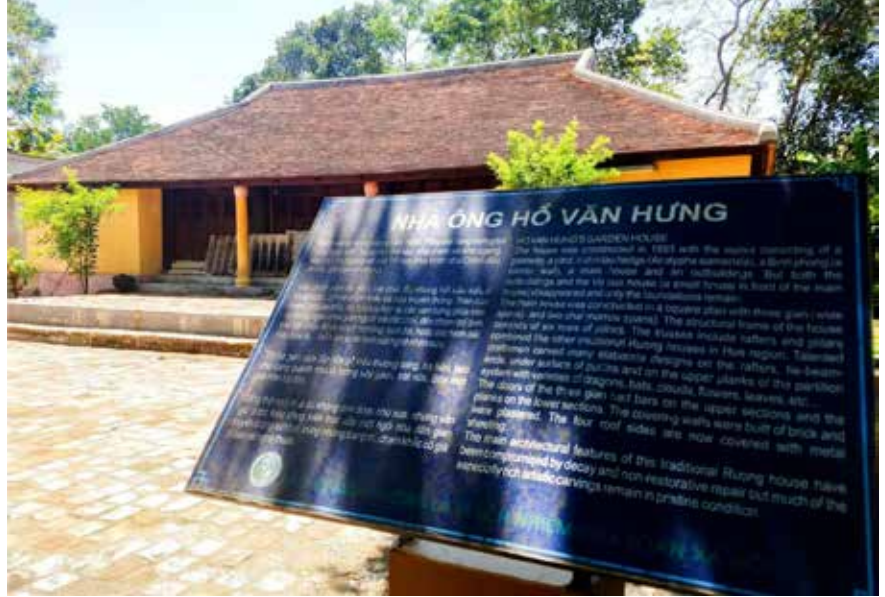
Nhà rường truyền thống ở làng cổ Phước Tích được tỉnh Thừa Thiên Huế hỗ trợ kinh phí trùng tu và bảo tồn nguyên trạng năm 2018

(1) Tính sở hữu: Nhà truyền thống đa phần thuộc quyền sở hữu tư nhân, nên việc bảo tồn (nguyên trạng) các công trình kiến trúc này còn phụ thuộc mong muốn của chủ nhà bởi gắn liền với ý thức và quyền lợi của người dân. Nói cách khác, bảo tồn mang lại lợi ích cho họ thì họ thực hiện, còn không sẽ ngược lại. May mắn là phần lớn những ngôi nhà truyền thống được các chủ nhân