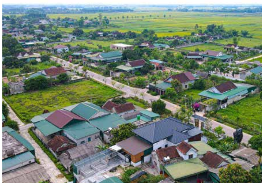
Cảnh quan kiến trúc nông thôn “truyền thống mới” ở thôn Việt Yên (xã Nam Điền, Thạch Hà, Hà Tĩnh)