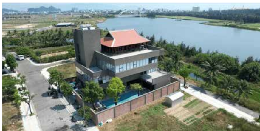
Cách thức tái hiện truyền thống - làm sống lại truyền thống nơi này ở một nơi khác và cắt đứt với bối cảnh nguyên gốc có xu hướng gia tăng, nhất là với những gia đình có điều kiện kinh tế (trong ảnh là ngôi nhà gỗ 3 gian truyền thống trên mái một biệt thự tại TP. Đà Nẵng)