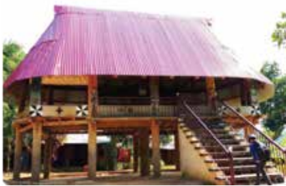
Nhà gươl truyền thống nguyên bản và nhà gươl đã được “nâng cấp” của đồng bào Cơ Tu tại tỉnh Quảng Nam

Nguồn: https://huengaynay.vn/van-hoa-nghe-thuat/thong-tin-van-hoa/nguoi-bao-ton-nha-guol-truyen-thong-141451.html