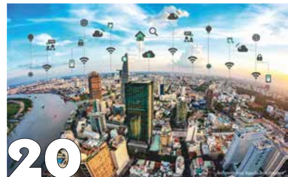
Ứng dụng công nghệ GeoAI trong quy hoạch