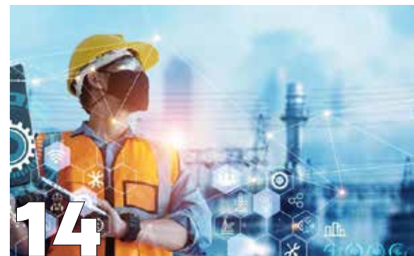
Xây dựng Bản sao số đô thị (UDT) trong quy hoạch và quản lý đô thị thông minh ở Việt Nam