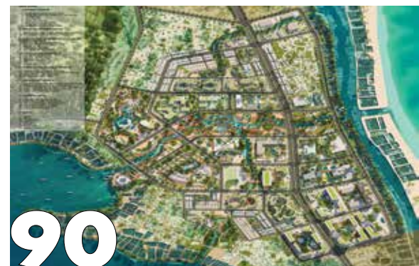
Đồ án tốt nghiệp xuất sắc năm 2025