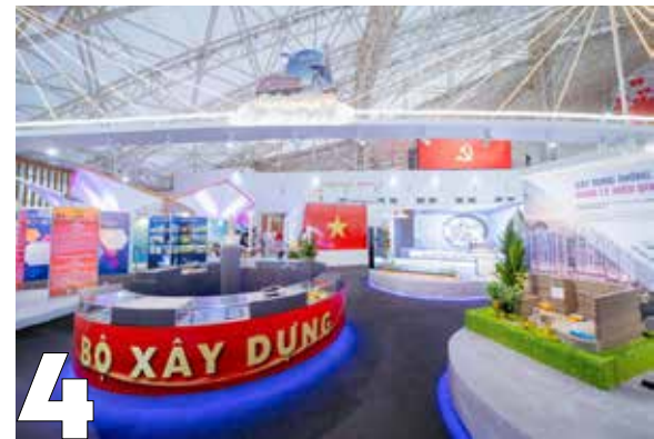
Triển lãm thành tựu ngành xây dựng 80 năm "Kiến tạo - Kết nối - Vươn mình"