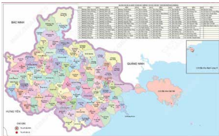
Hình 1: Bản đồ thành phố Hải Phòng

Tại Việt Nam, các nghiên cứu nhấn mạnh rằng các đô thị ven biển như Hải Phòng đang đối mặt với nguy cơ ngập lụt, lấn biển và mưa cực đoan ngày càng tăng, đòi hỏi các công cụ số hóa để giám sát và cảnh báo kịp thời [1][15] . Và một số nghiên cứu cũng chỉ ra rằng RS và GIS đã được đưa vào một số dự án quy hoạch và giám sát tài nguyên tại các đô thị lớn như Hà Nội, TP.HCM, Hải Phòng [1][3][16] . Tuy nhiên, việc ứng dụng các công nghệ này còn gặp nhiều khó khăn và rào cản, bao gồm: thiếu dữ liệu không gian chính xác, hạn chế về tài chính và năng lực sử dụng công nghệ tại địa phương [3][4][17] . Dù một số nghiên cứu thực nghiệm tại Hà Nội [18] , Hải Phòng [19][20] và các tỉnh ven biển [21] đã chứng minh hiệu quả của RS và