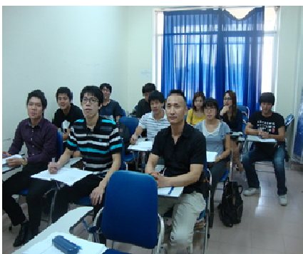
Sinh viên Hàn Quốc lớp Cử nhân Tiếng Việt khóa 2008-2012 trong lớp học

Nam, đáp ứng yêu cầu của các công ti, cơ quan Hàn Quốc hoạt động ở Việt Nam, chẳng hạn mỗi năm dạy tiếng Việt cơ bản cho khoảng 30 - 40 nhân viên của Công ti Hansae; đào tạo nhiều khóa Tiếng Việt cho các tình nguyện viên thuộc Văn phòng Koica (Cơ quan Hợp tác Quốc tế Hàn Quốc - Korea International Cooperation Agency) tại TPHCM; đồng thời phục vụ cho việc thực hiện chương trình Thực tế Tiếng Việt của sinh viên Trường Đại học Ngoại ngữ Hàn Quốc...