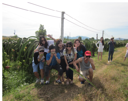
Sinh viên Hàn Quốc các lớp Cử nhân Tiếng Việt tham quan vườn thanh long ở Bình Thuận hè 2012