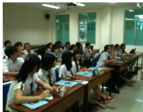
Học sinh Trường Trung học Thực hành Trường ĐHSP TPHCM trong lớp học Tiếng Hàn khóa 1 (3-3-2014 – 16-6-2014)

Nằm trong kế hoạch chính thức đưa tiếng Hàn thành một ngoại ngữ được đào tạo trong Trường ĐHSP TPHCM, một chương trình ngoại ngữ phụ (ngoại ngữ thứ hai) - Tiếng Hàn dành cho sinh viên các khoa ngoại ngữ trong Trường - đã được biên soạn và đã được Trường thông qua. Ngoài các môn học bắt buộc là các kiến thức và kỹ năng tiếng Hàn cơ bản được cung cấp trong hai năm đầu khóa học, chương trình này còn bao gồm bốn