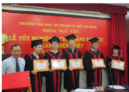
Sinh viên Hàn Quốc lớp Cử nhân Tiếng Việt khóa 2009-2013 nhận bằng tốt nghiệp đại học