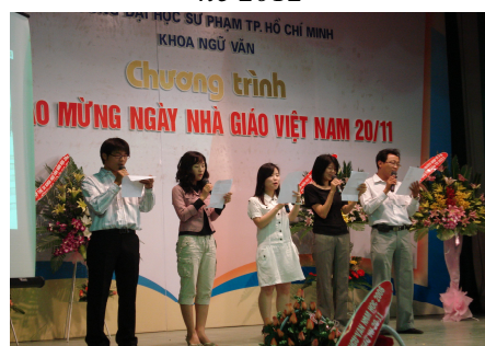
Sinh viên Hàn Quốc lớp Cử nhân Tiếng Việt khóa 2005-2009 biểu diễn văn nghệ chào mừng Ngày Nhà giáo Việt Nam 20-11-2006