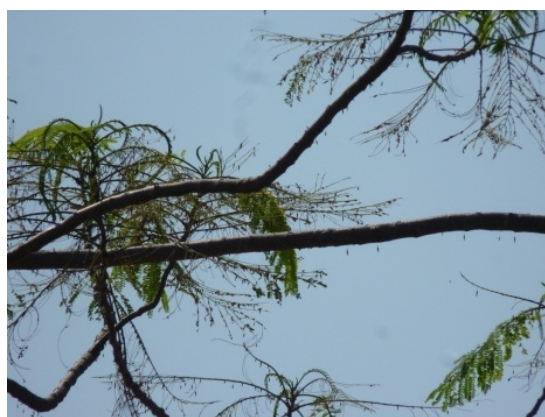
Hình 11. Tán Phượng vĩ trên đường Mai Chí Thọ bị sâu bao P.plagiophleps tấn công