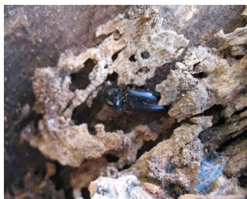
Hình 102. Bộ cánh cứng Cylindromicrus sp. trên thân cây Me tây ở đường Nguyễn Văn Cừ