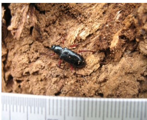
Hình 9. Bộ cánh cứng Cryptoteles sp. đục thân cây Me tây trên đường Nguyễn Văn Cừ