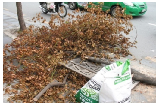
(b) Phần ngọn cây Long nã bị héo chết do không đủ chất dinh dưỡng truyền lên