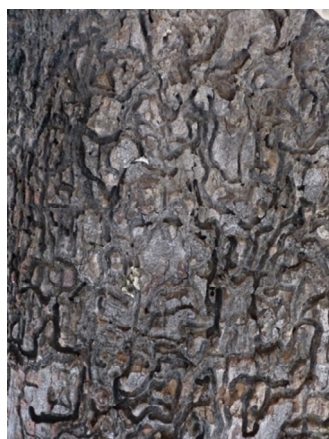
Hình 4. Vỏ thân cây Dầu con rái trên đường An Dương Vương bị bộ cánh cứng (họ Cerambycidae) tấn công để lại các đường rãnh