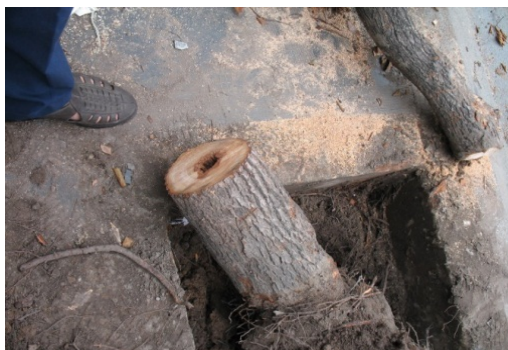
(a) Đoạn gốc cây Long nã bị mối tấn công ở giữa lõi gỗ