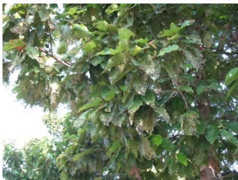
(a) Tán lá cây dầu trên đường Võ Văn Kiệt