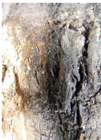
Hình 3. Bộ cánh cứng Heterobostrychus cf. aequalis ghi nhận được trên cây Bằng lăng ở đường Nguyễn Đình Chiểu