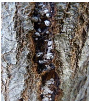
Hình 6. Rệp cây Paracoccus cf. marginatus Williams and Granara de Willink đang hút nhựa cây Giáng hương trên đường Hàm Nghi