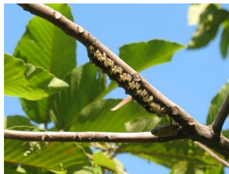
(b) Sâu bướm Lymantria sp.